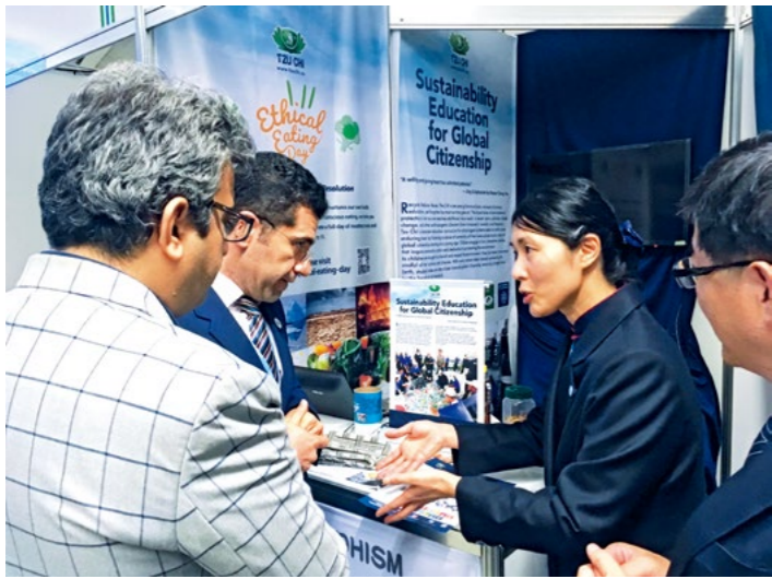
慈济志工二〇一八年十二月参加于波兰举办之联合国气候变迁会议，学习有关地球暖化的新知，也与不同团体交流慈济环保经验与成果。

在二〇一六年的牲畜年产量统计，每秒钟全球有两千三百五十二只牲畜被杀；换算下来，全球一日要宰杀两亿三百多万只动物。