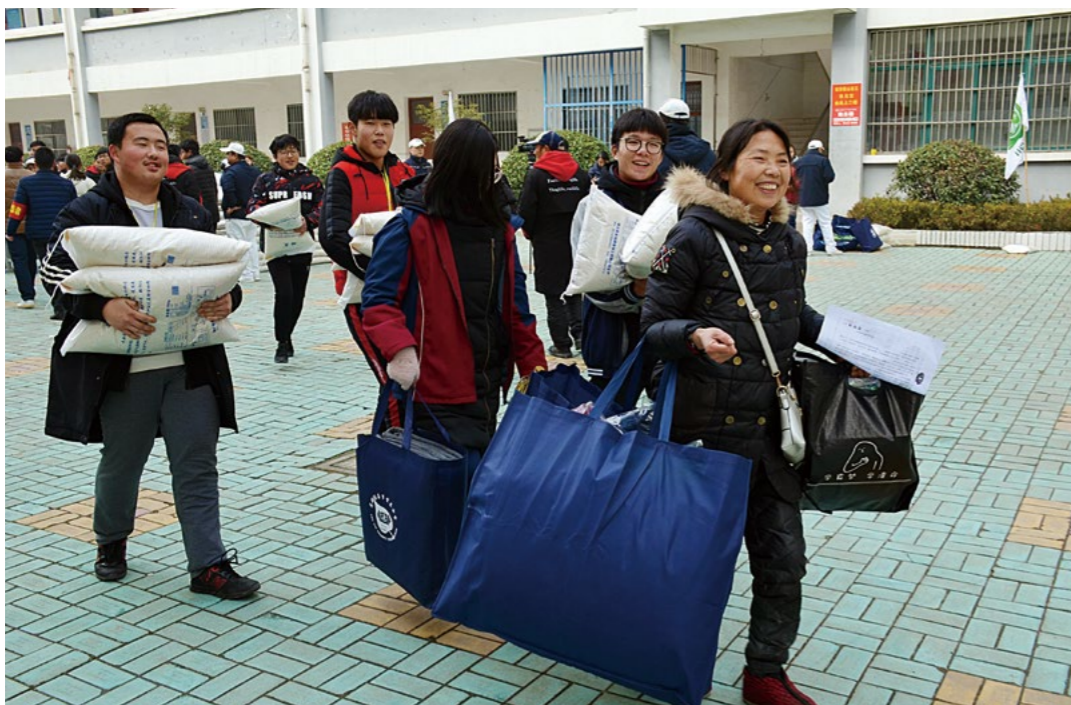
乡亲们抱着大米，提着大包物资，带着丰富的年货欢欢喜喜往家里走。

济的师姑、师伯们无私的爱。感恩慈济人，感恩学校领导和老师，感恩父母，感恩一切！”