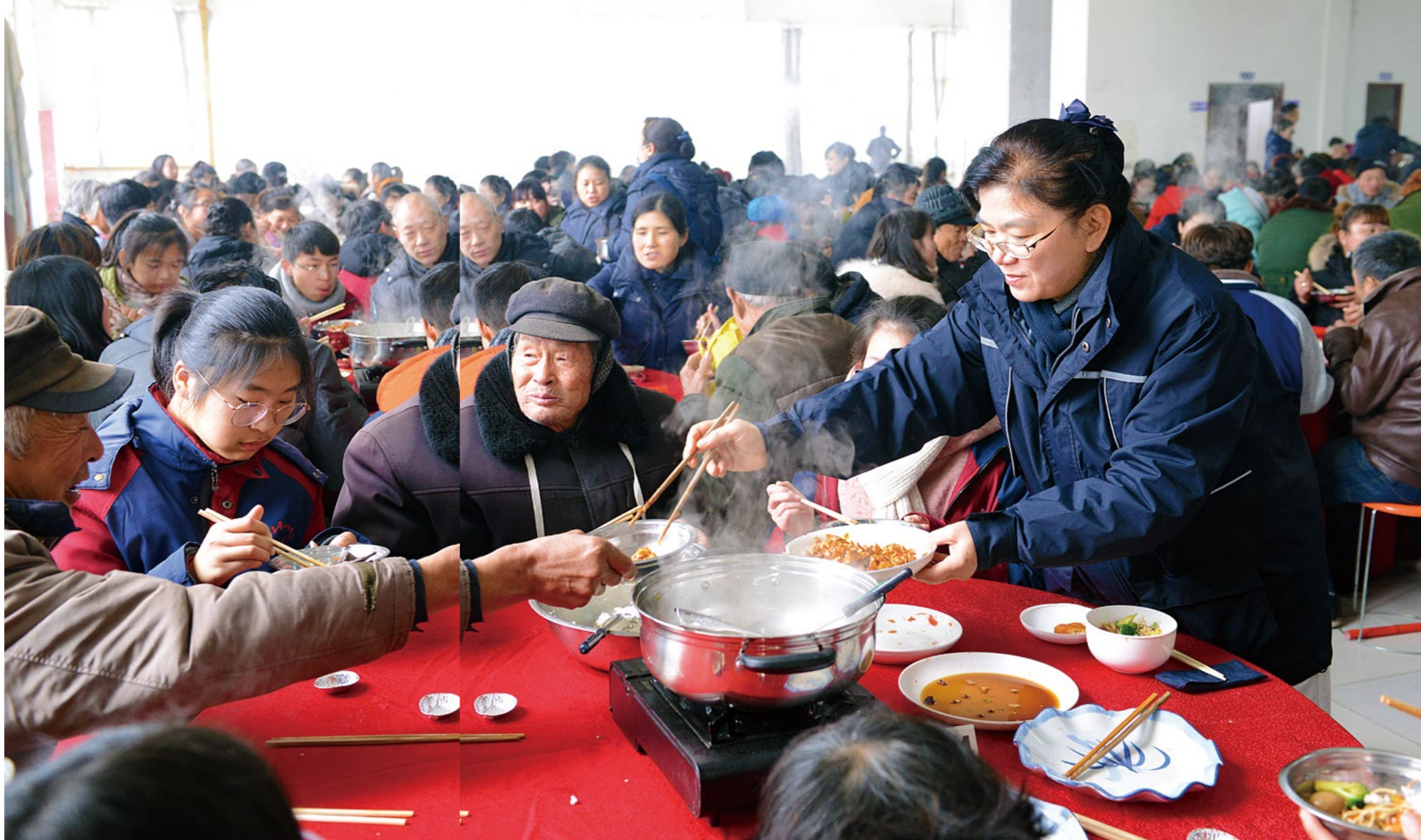
（上图）热腾腾的火锅，志工为乡亲们夹菜盛汤，就像对待家中的长辈一样疼惜。

“在过去的一年里，时常感受到这份资助凝聚的关心与鼓励，要奋发努力，以最优秀的成绩回报慈