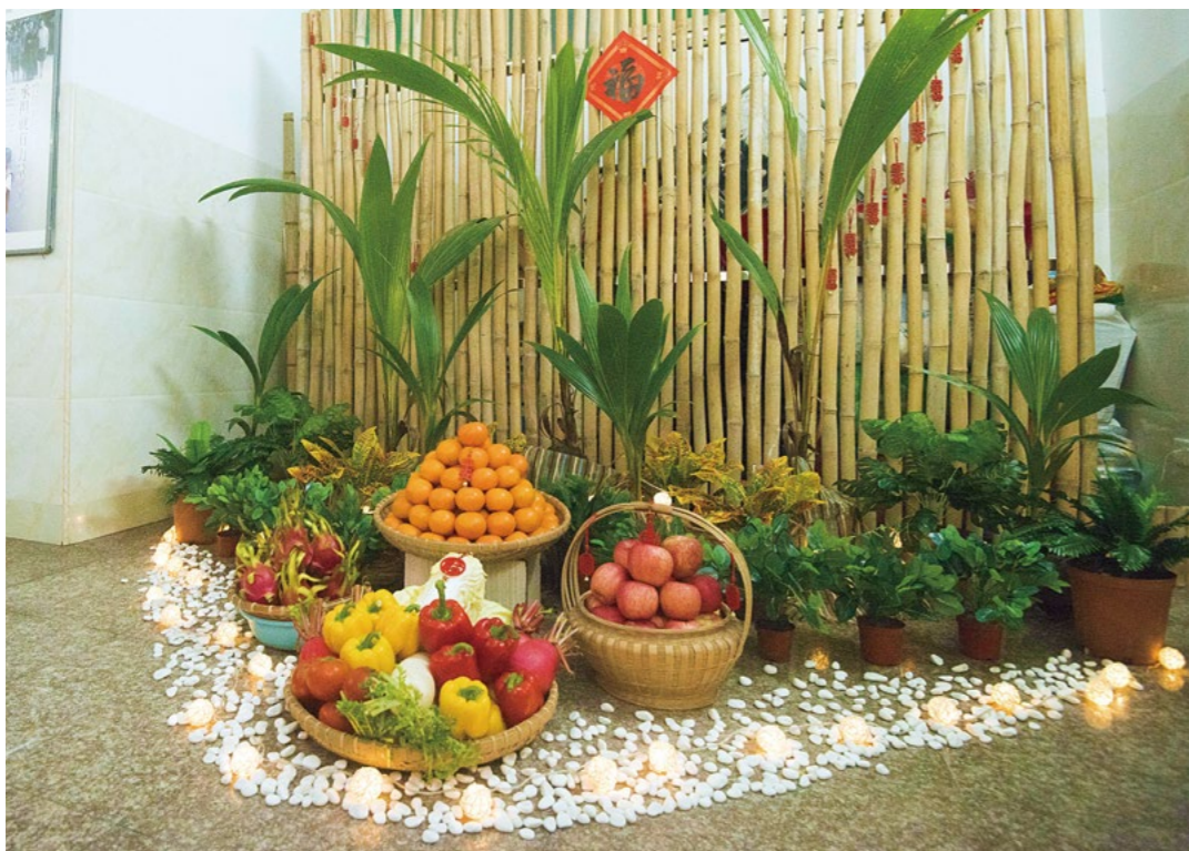
环保布展：海南特色的椰子苗，绿植和灯是回收的，新鲜的蔬果装点后可以食用。

海口来支援岁末祝福的志工，个个都是十分精进的环保菩萨，虽然大都年过半百，但是做起环保来的快速利落，让很多年轻人望尘莫及。