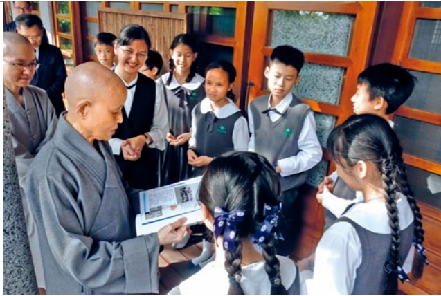
◀ 台南慈济小学六年级毕业生在师长陪伴下返花寻根，班代表呈小书予上人。（12月21日）