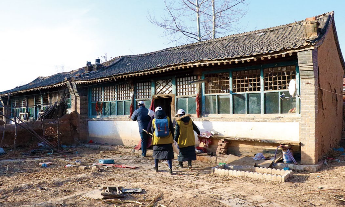
(上图) 元旦的前一天，志工一行十人冒着严寒走进白奶奶家，送来新年祝福及过冬物资。 (下图) 志工喂白奶奶吃威化饼，奶奶特别开心，连着说好吃好吃。