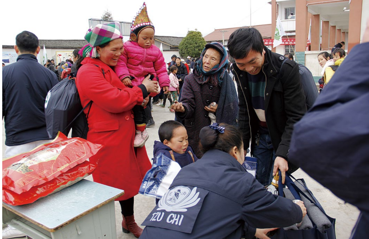
领到物资的乡亲，肩上背着、手里提着，每个人心里都十分欢喜，志工也一起开心。