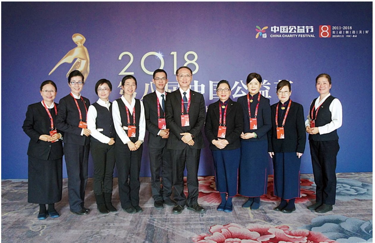
撰文/摄影 慈济慈善事业基金会