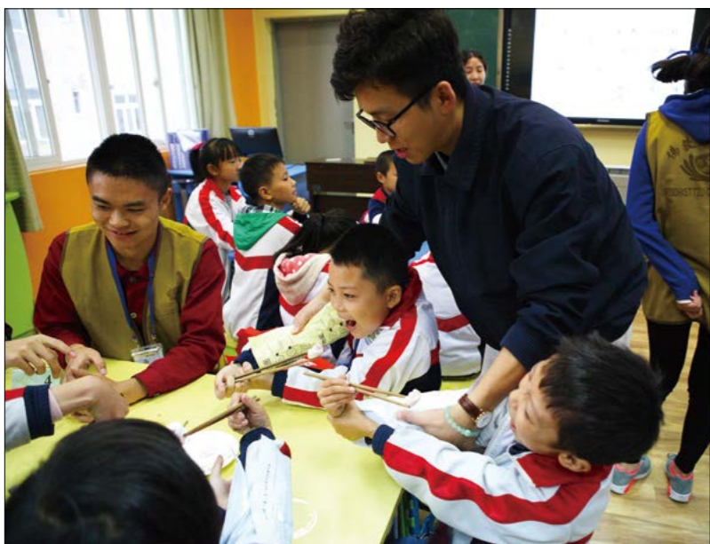
《大爱棉花糖》的游戏启发小朋友们如何在手臂不能弯曲的情况下吃到棉花糖。

让棉花糖对准张开的嘴巴，采取自由掉落的方式来吃糖。另一边的小朋友想到用分享互助的方式来吃到糖。他边做边说：“我来喂你吃，你喂我吃，可以吗？”事实证明，互帮互助让大家都吃到了糖果。