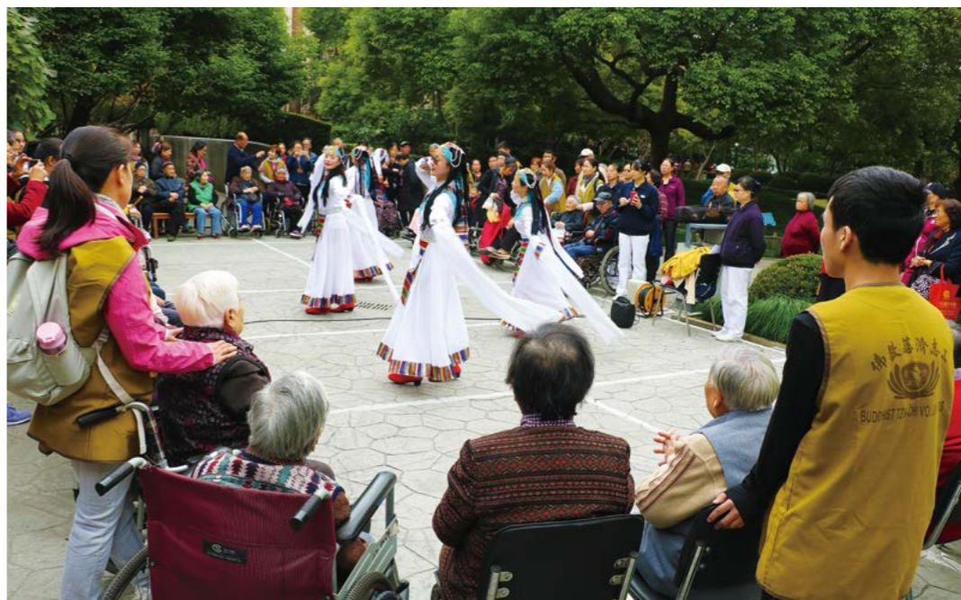
受邀而来的舞蹈队，舞姿优美，服饰亮丽，表演让人赏心悦目。

“我可以去公园吗？”看到志工前来，老人焦急地问。“我们就是来接您的。”听到志工回答，老人眼里放出开心的光芒，迫不及待地跟着志工出门。