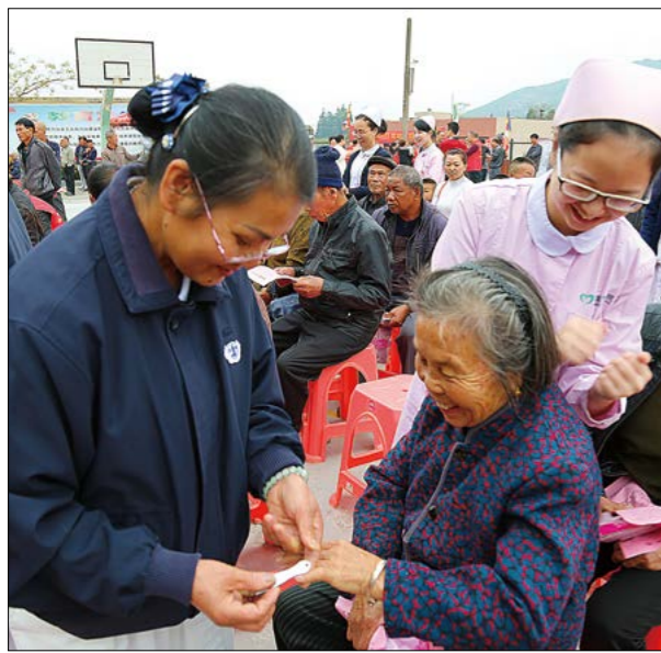
(下) 候诊区里，医护志工为乡亲们按摩互动。

人员就一起到学校打扫卫生，清理教室，布置义诊现场。现场还设有独立的候诊间，方便乡亲前来就诊；而距离各个科室不远的是取药窗口和化验室，俨然一个微缩版的医院。义诊开始，乡亲们在志工和医护人员的引领下，一一来到对应诊室。