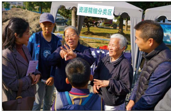
志工把握机会向每一位市民朋友介绍，环保其实是每个人举手之劳的事。