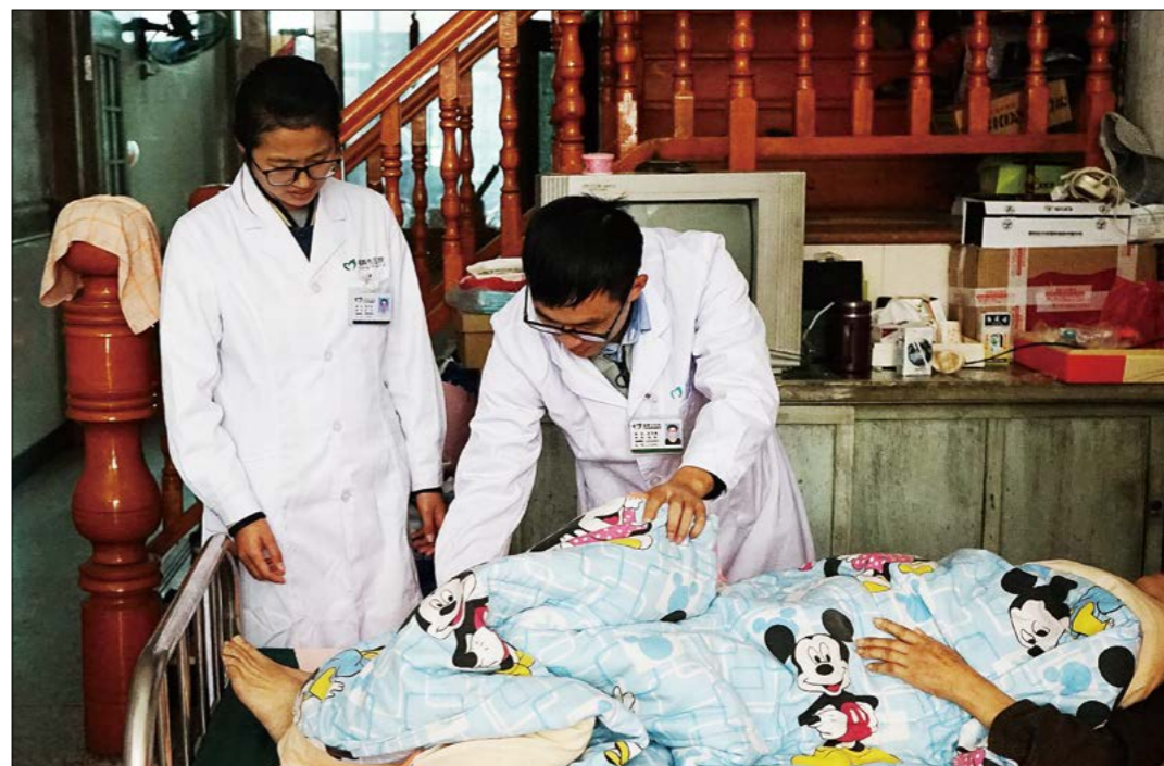
医护人员看望瘫痪在床的乡亲，为她做各项检查。