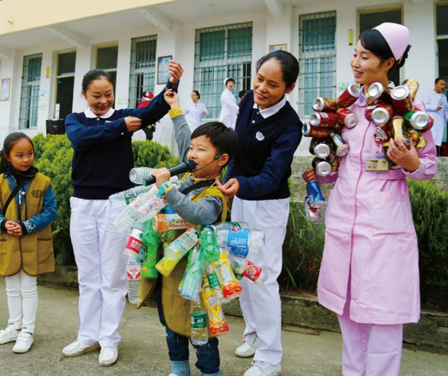
(上) 小志工也加入环保倡导行列，为乡亲们解说环保知识。