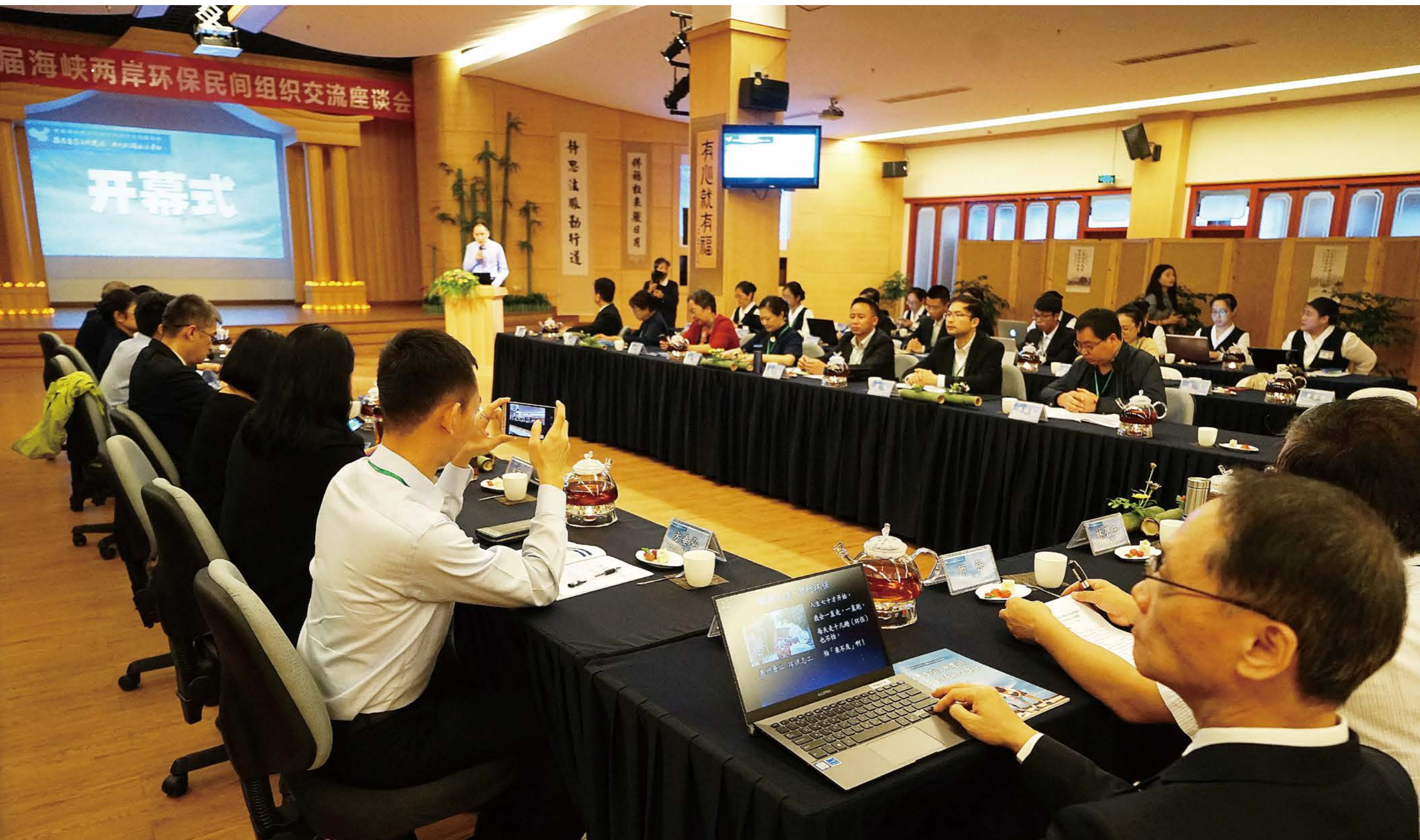
二〇一七年十一月十四日，首届海峡两岸环保民间组织交流座谈会在厦门慈济举办。