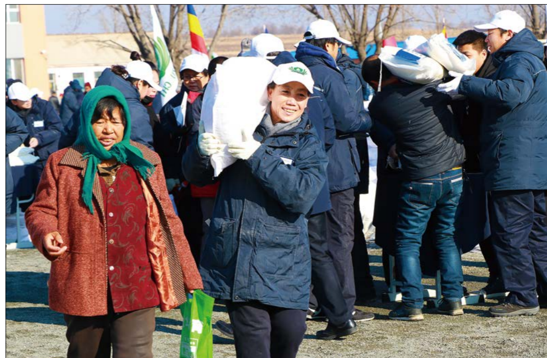
志工承担起了负重的任务，帮乡亲扛着米面的身影，穿梭在人群中。摄影/文又加