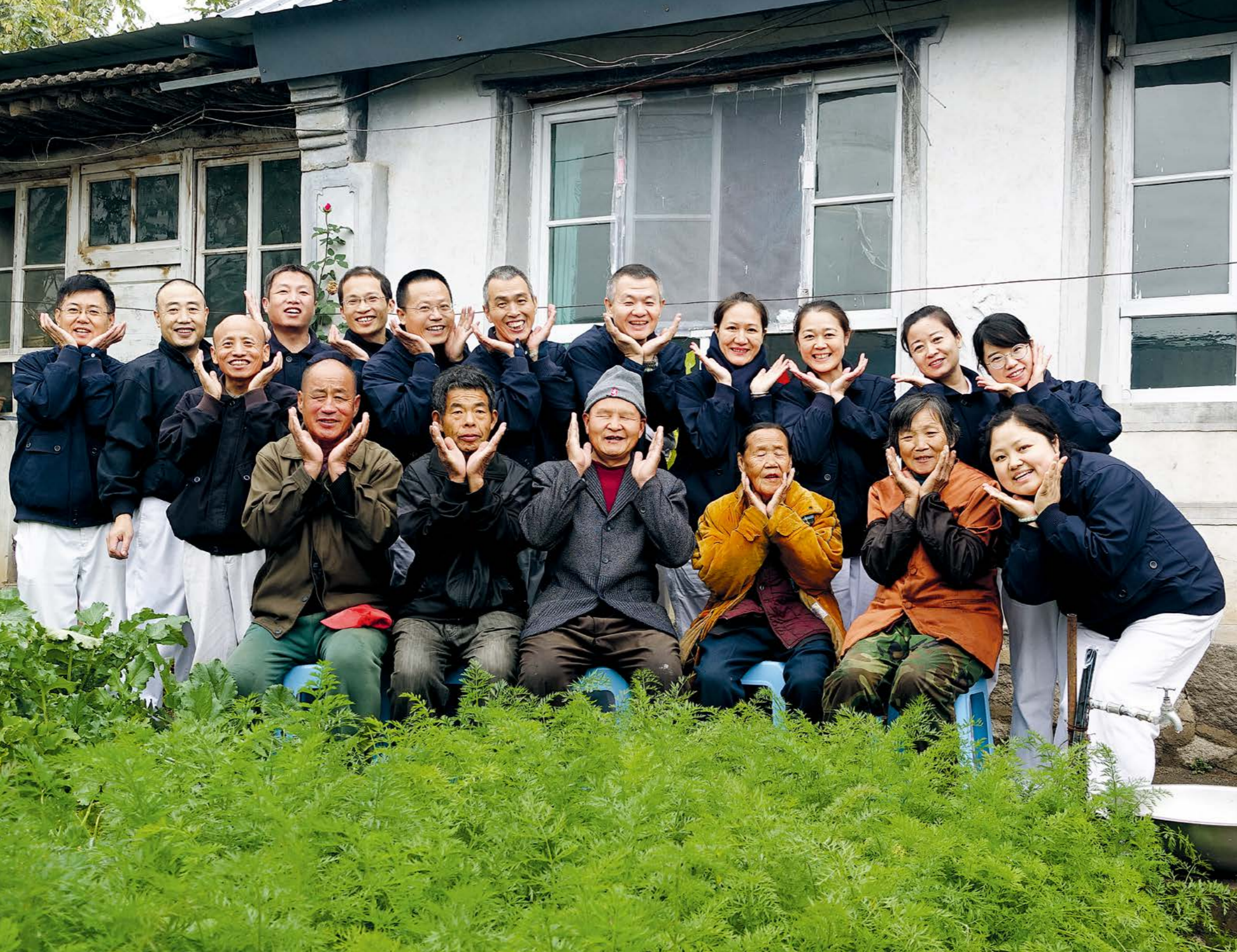
在富岗乡双合庄村，爱民的几位邻居都年事已高，基本都有残缺，但相依相惜，志工也请他们相互照顾，在爱民家绿意盎然的菜园前留下合影。