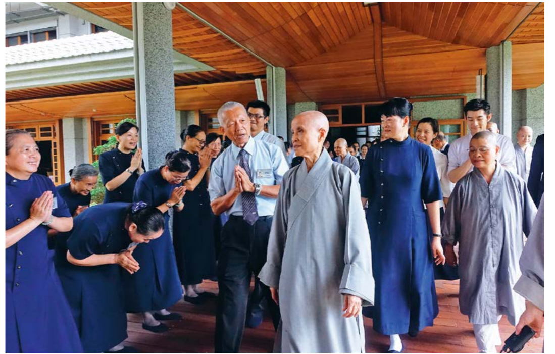
▼台中慈济人回到精舍参加短期精进，上人期勉法入心、法入行。（10月17日）

区提供救援。上人勉励，灾难总是会过去，尽心尽力救助受灾者，也要带动爱心，在人与人之间相互帮助。