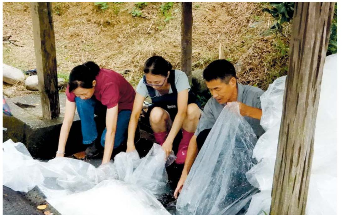
▲为减少垃圾袋弃置、焚烧产生污染，新北市澳底环保志工多年来捡回鱼市场的塑胶袋至水沟边清洗回收。