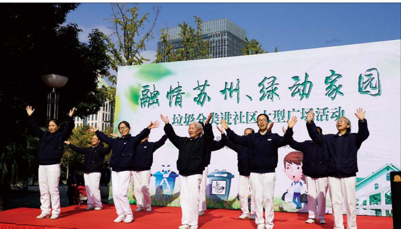
志工们用手语演绎《清扫是舞蹈》。