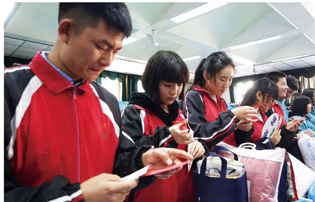
看着手中志工亲手制作的静思语书签，同学们眼睛湿润了。

就是这样的真情通信方式，让大爱妈妈爸爸们和孩子们之间建立起了深厚的感情，彼此信赖，成了真正的亲人。虽然一年两度的助学金发放，对于志工与孩子们来说相聚太过短暂，但其中以书信为媒的情却深，意更浓，愿这份大爱蔓延相续，充满人间。