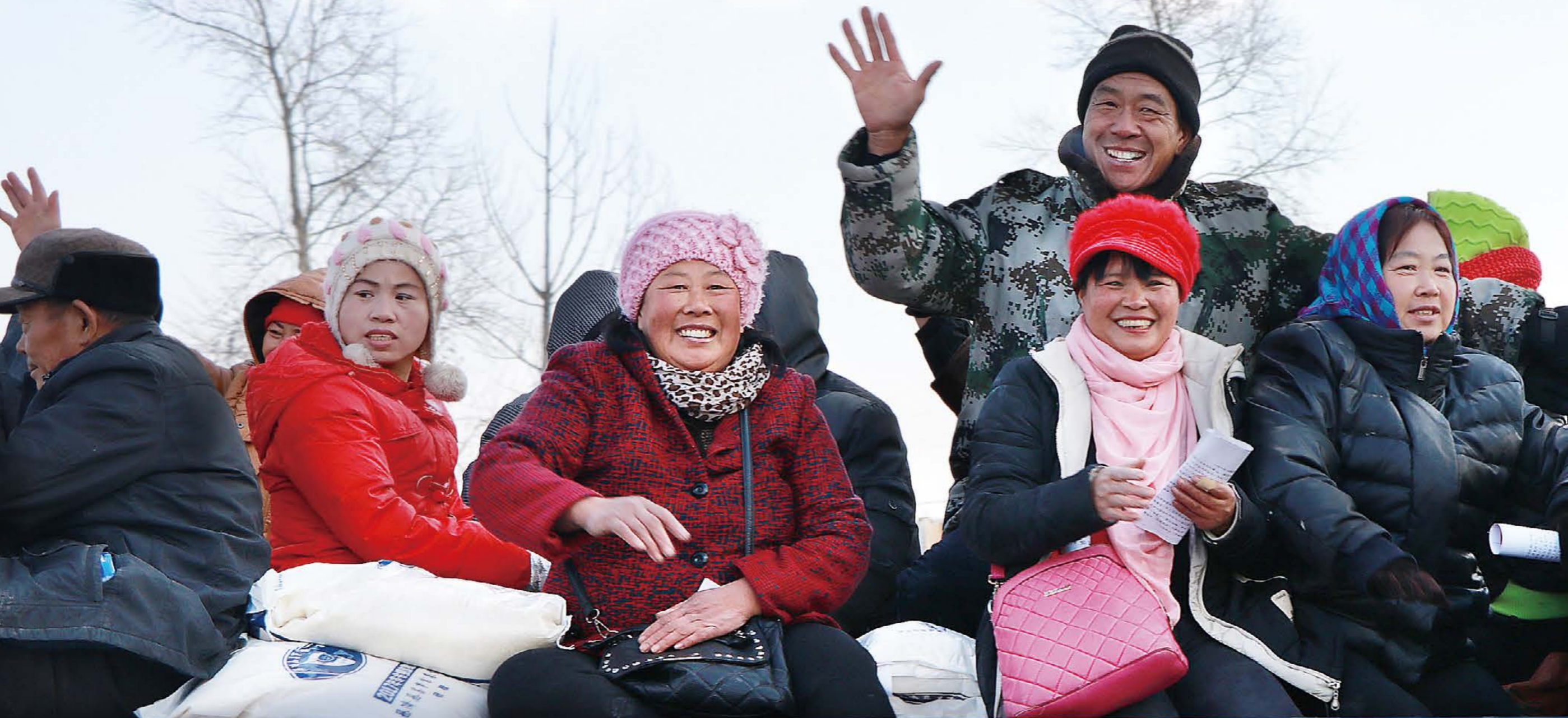
领取完物资的乡亲带着志工们满满的爱与祝福，欢喜地和大家告别。摄影/文又加