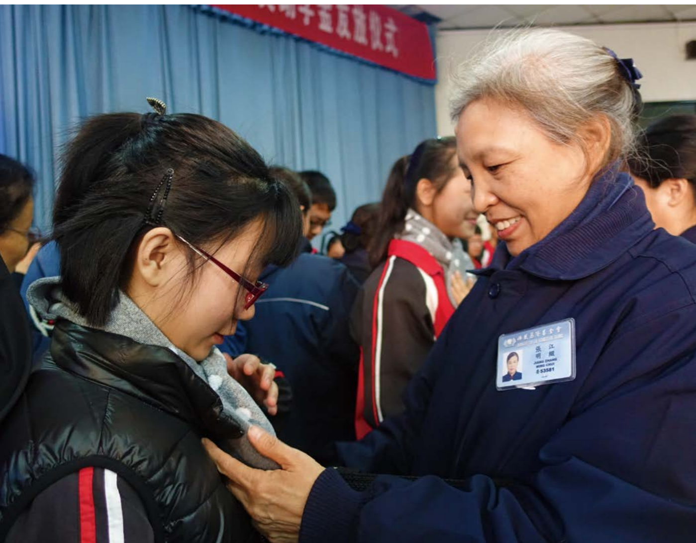
慈济志工在易县启动“一月一家书”的助学活动，志工们通过信件与关怀的学子架起沟通的桥梁。