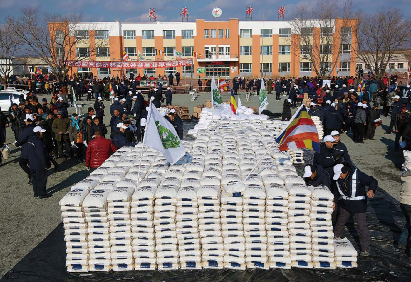
慈济在东北的首场冬令发放于十一月十一日在吉林展开。

“水患后对我们嘘寒问暖的，问我们缺什么，我们说缺米、面、油，没想到你们真的来了，我们非常感谢。”乡亲张艳听记起志工在她受灾最无助的时候，给予安慰的力量，这一份情她永远忘不了。