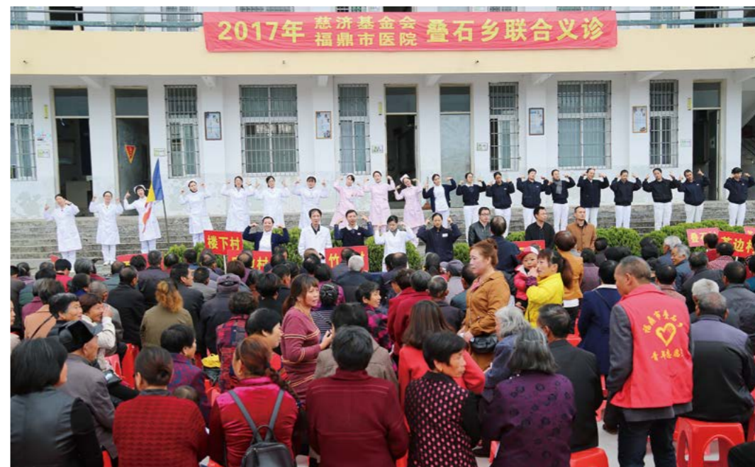
双十一福鼎市医院与慈济慈善基金会联合义诊在福鼎市叠石乡叠石学校进行。摄影/郑尔婷

考虑到一些乡亲因为路途遥远或腿脚不便无法到现场，医护人员组成小分队到病患家里义诊。摄影/郑尔婷