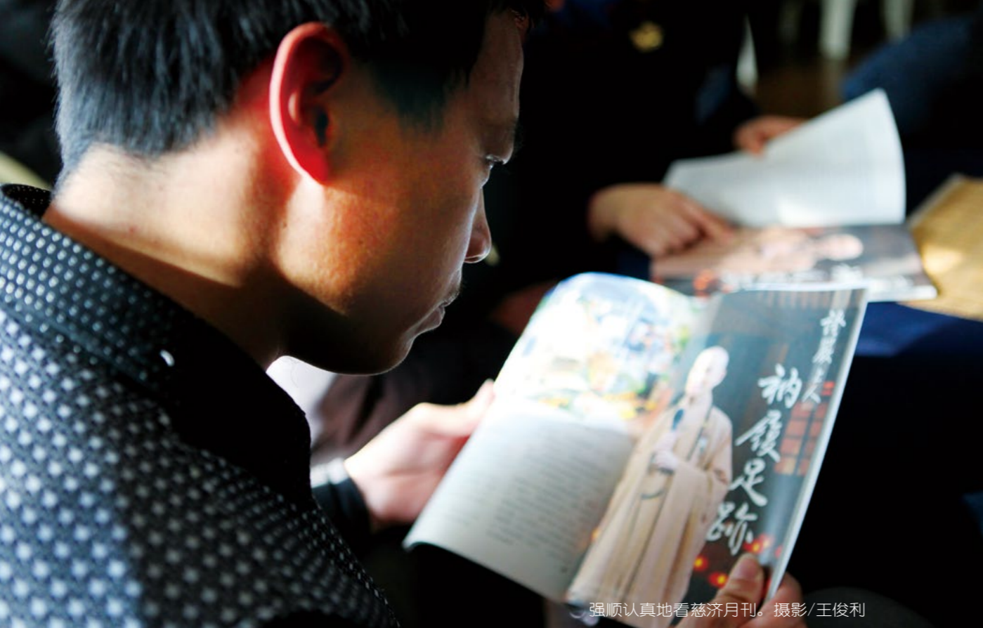
强顺认真地看慈济月刊。