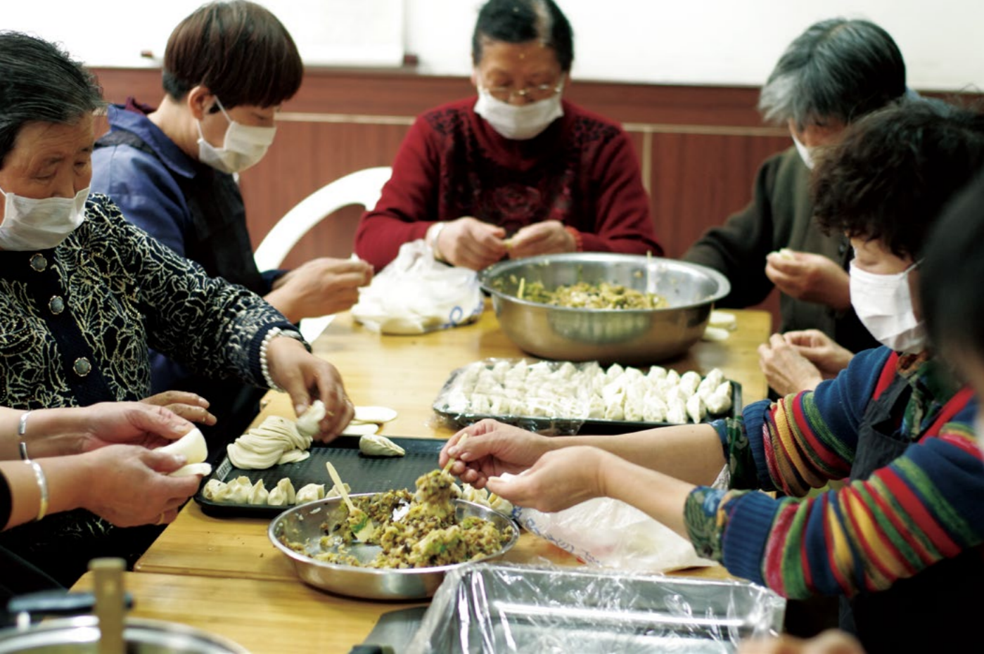
发放前一天一大早，许多青海志工就赶到会所，为隔天的冬令发放活动包饺子。