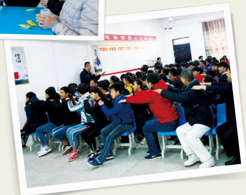
（下图）一个“伊比压压”团康游戏，让志工与孩子们的距离又拉近了许多。