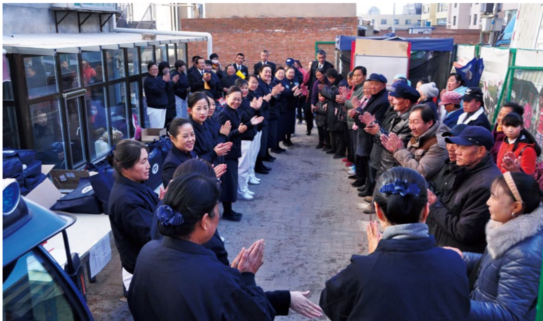
“我的快乐来自你的笑声，而你如果流泪我会比你更心痛……”发放之前，志工们与乡亲一同唱起《一家人》。

报，使我对慈济这个慈善团体产生了好奇，后来又参加了甘肃靖远冬令发放，看到慈济在那里修水窖，建大爱村，回来后我就想如何发挥青海当地人善良的本性，接续起这条慈善之路。”下午的岁末祝福感恩会，志工祁海明特地分享自己做慈济的“生命故事”。