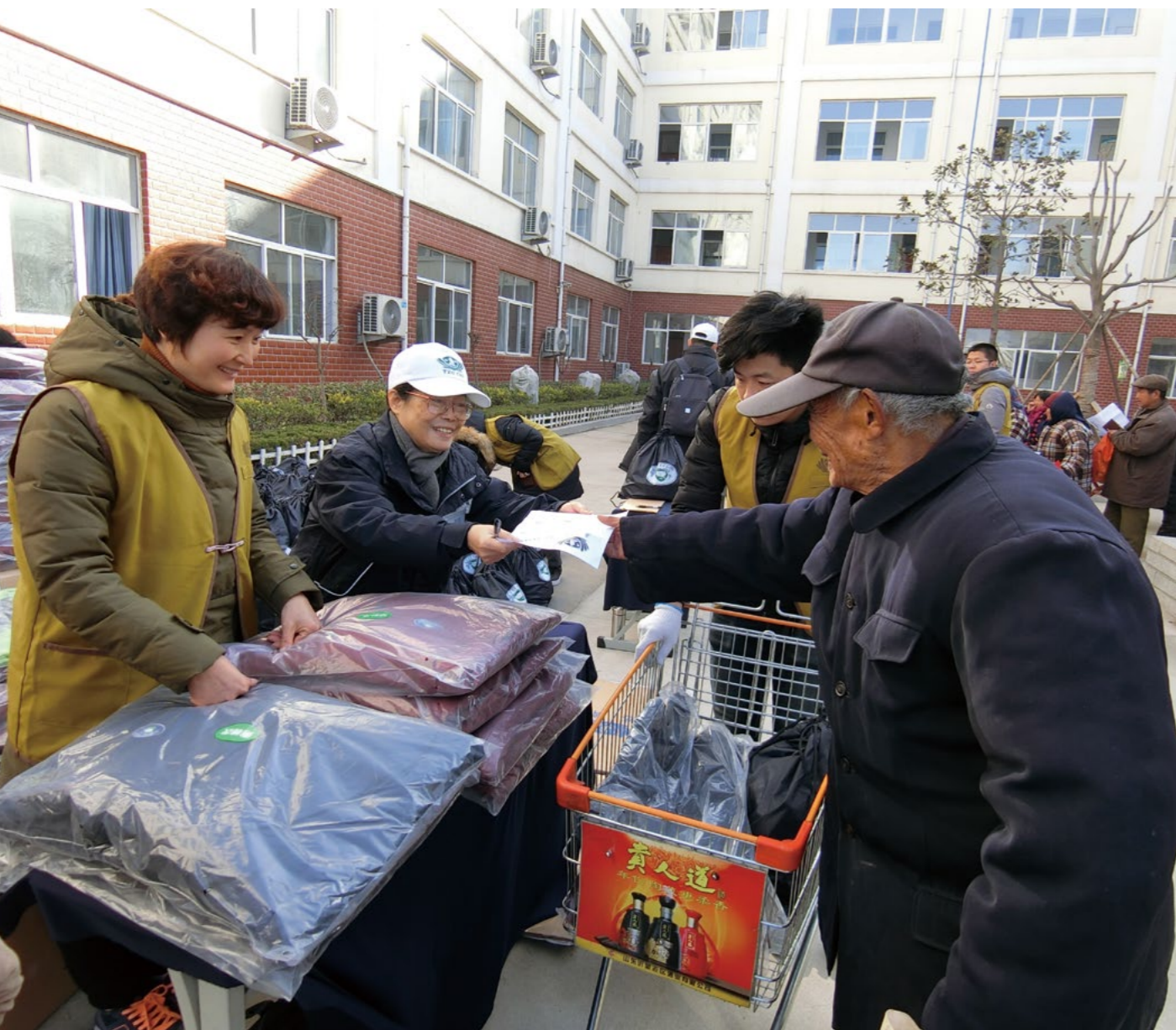
临沂政府协助向大卖场商借上百辆推车，让志工能协助年纪大的乡亲运送物资。

清晨天空灰濛濛，墨绿草皮上洒上一层白霜。早上七点半左右，山东临沂市临沭县第四中学门口，已有许多乡亲远地而来在栅门外等候。