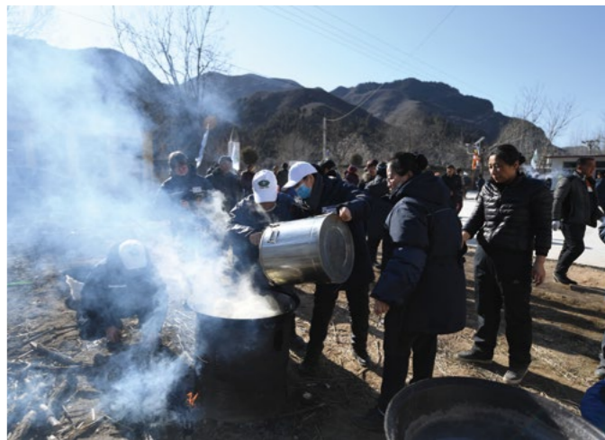
志工为乡亲随时供应热食，天寒心暖，亲如一家。

捧着静思语卷轴，用标准的九十度鞠躬恭敬为乡亲奉上静思语，恭敬与谦卑令领取物资的乡亲和周围志工们赞叹。