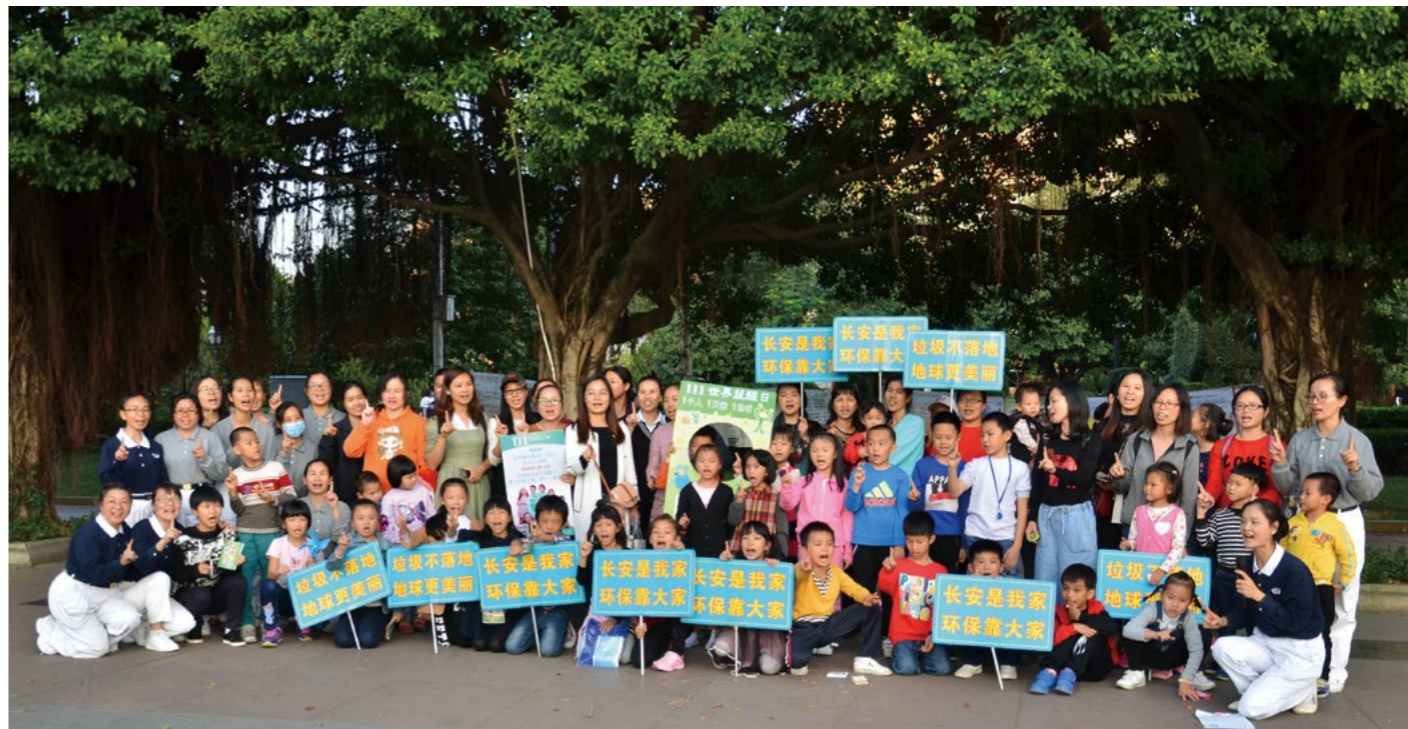
活动圆满结束，六年的环保推广，持续不断，与大家结份善缘，将爱传出去。

随着时间的流逝，每月一次的环保活动即将结束，虽只有短短的两个小时，但六年不间断的环保宣导，志工在这里也结了很多的好缘，虽是环保的宣导，但更希望把这份爱大地的心传到每个人的心中。 ❷