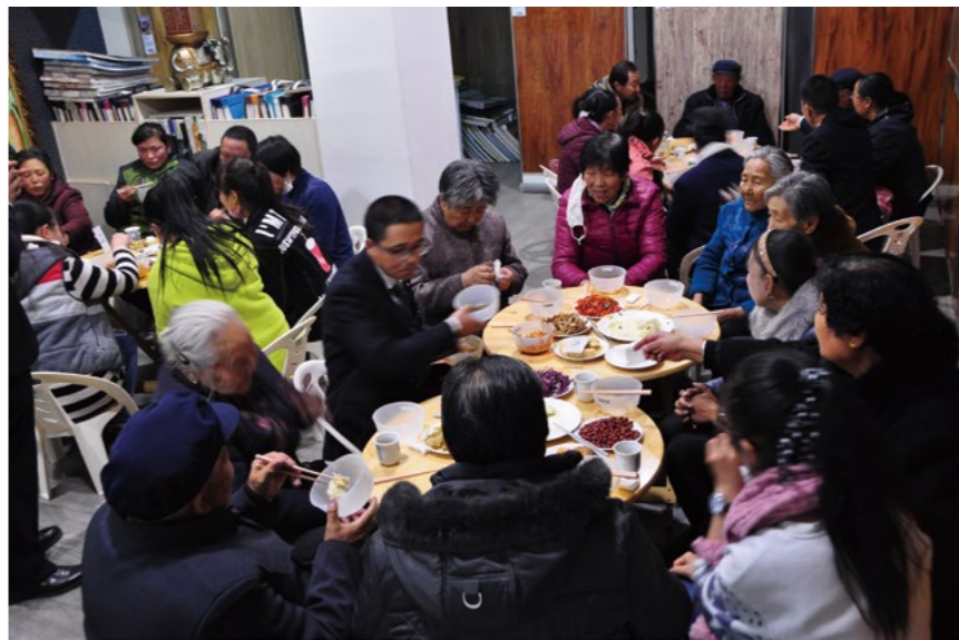
志工们与感恩户一起围炉，希望这份真诚的爱暖身更暖心。

“九六年，咱们青海玉树发生了特别严重的雪灾，很多牧民和乡亲都处于困难的状态。最初，我从大爱电视台上了解到有一些台湾人自掏腰包来玉树救灾，完全不求回