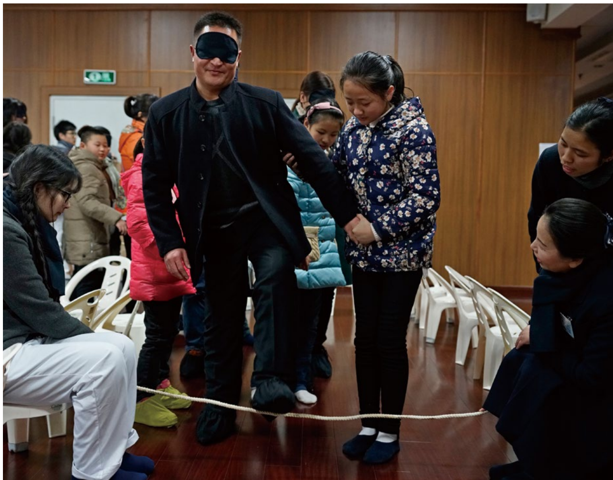
撰文/范一莲