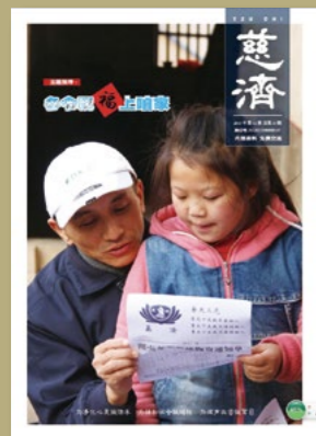
封面图说： 湖南长沙莲花镇，慈济志工带着祝福入户送上冬令物资，志工为孩子读证严上人的关怀信。