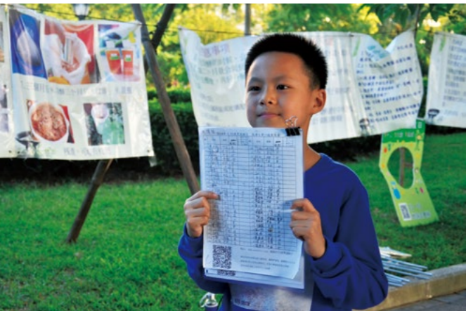
(上图) 环保酵素实做，让同学们知道平常不要的果皮，也能充分利用，做成清洁用的环保酵素。