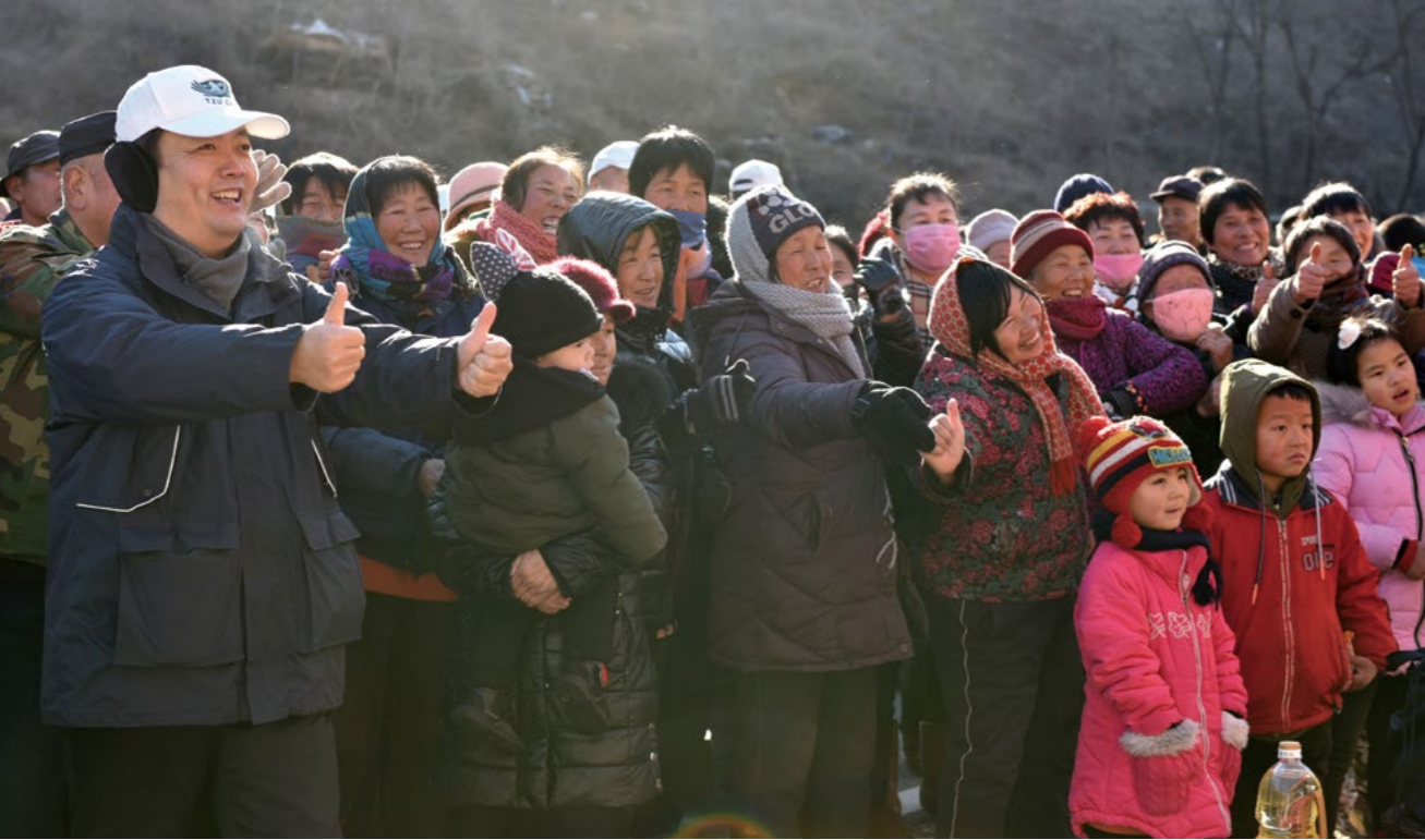
志工带动淳朴的村民们为加班加点的领导干部们送上爱的鼓励！