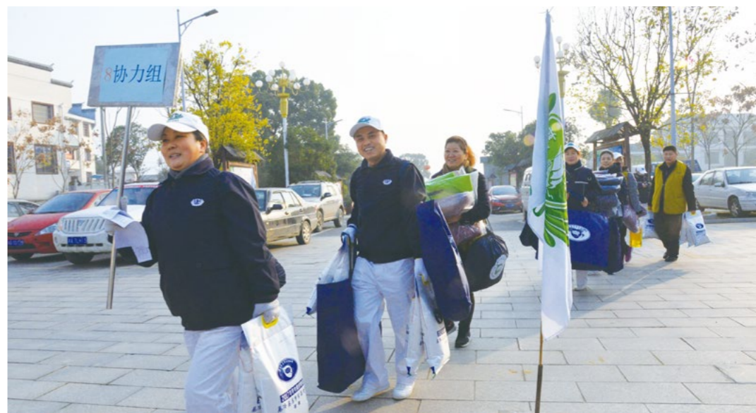
志工手提冬令物资，分组入户关怀。