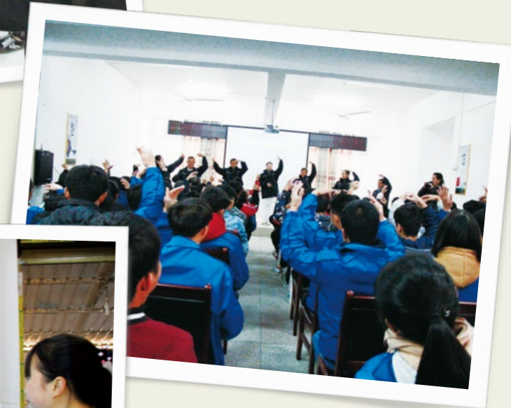
（下图）志工还带来一首《让爱传出去》，传递全球慈济人的祝福，送给大山的孩子。