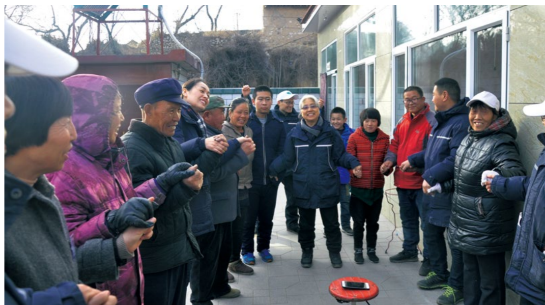
左邻右舍的乡亲们聚在了一起，和志工们一起载歌载舞。

带上发放的物资，带上活动结束的不舍，感恩户踏上了归途。期待他们变得更好，变成手心向下的人，成为一个充满爱与关怀的人。❶