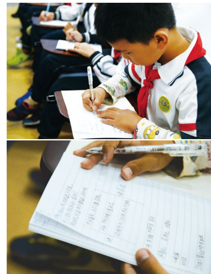
环保课堂中学生认真作笔记。

在学校的录播室，正同时举行垃圾分类环保知识的宣导。志工们以体验“天地告急”的活动，带动课堂的活泼气氛。