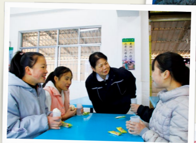
（上图）志工们想到有些孩子可能没吃早餐，特地在食堂准备了热水及点心给孩子们填填肚子。