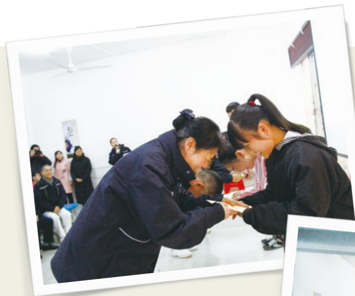
（上图）志工以感恩的心，双手送上对孩子最虔诚的祝福。

在这里我也向你们承诺，决不做温室之花。滴水之恩，当涌泉相报，我一定会以你们为榜样，努力学习，不负众望，回馈社会，报效祖国。