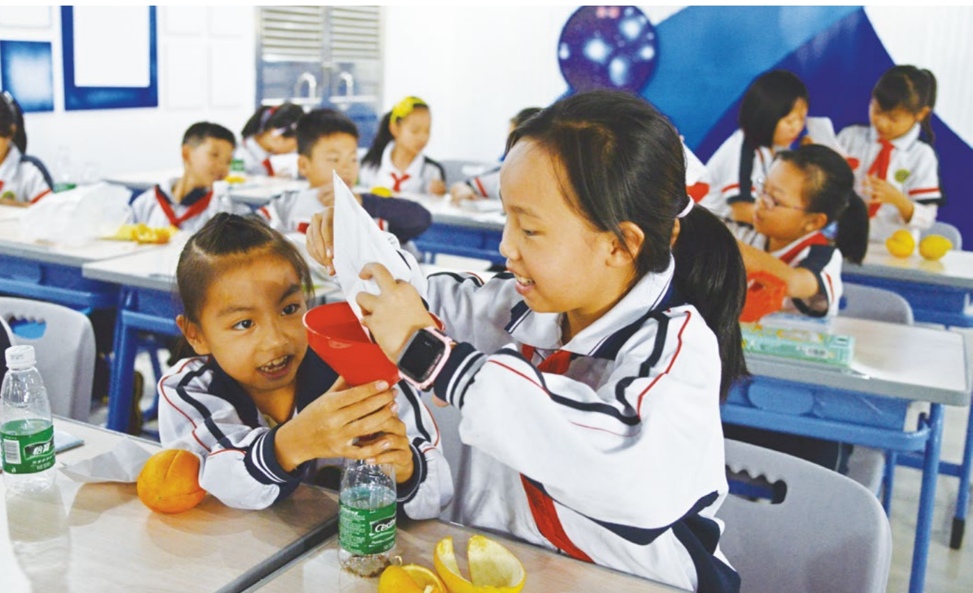
孩子们对制作容易、好用又不花钱的环保酵素非常感兴趣，纷纷动手尝试制作。