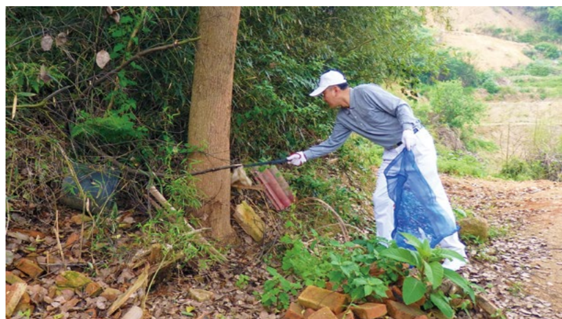
长沙慈济志工受邀前往双盆村倡导环保，并到旅游景点东鹞山净山。

黄主任尤其意识到教育的重要性，所以这次的环保活动，也邀约家长带孩子来参加。黄主任的女儿黄