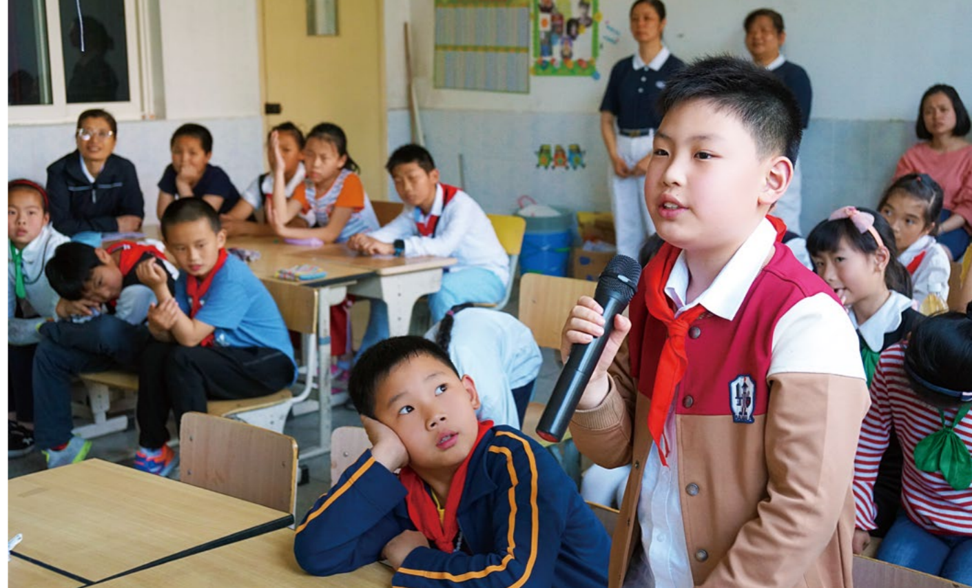
(上图) 亲自参与体验的学生说：“节约用水很重要，通过今天的学习，我会在开水龙头时开到筷子的细度，这样更加珍惜水！”