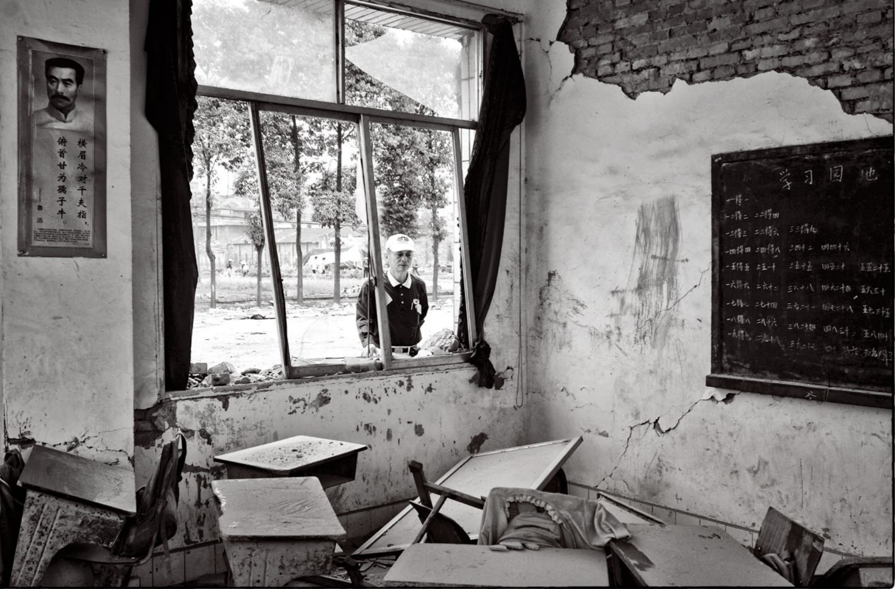
什邡市洛水镇于川震中受灾严重，灾后数天，慈济志工来到洛水小学勘查受损情形，并锁定此地为救援重点。

十年前的那一场浩劫，改变了许多人，有的人蓦然死去，有的人残缺地活着，有的人带着仅剩的回忆看向远方……死去的人固然可悲可叹，活着的人却也是悲伤满满。