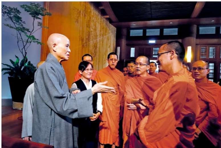
◀ (上图) 泰国佛统府智舍森林寺法师來台參訪，拜會上人。(4月16日)