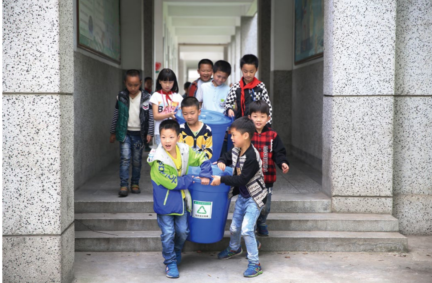
洛水慈济小学走廊或操场看不见纸屑，能回收的资源都放进教室内的蓝色桶子，每一天由孩子们送到环保教育站做回收分类。

环保站成立，校方让学生参与环保站管理与营运，设立站长、副站长职务，开放环保小菁英参与竞选，更邀约什邡大爱感恩环保人文