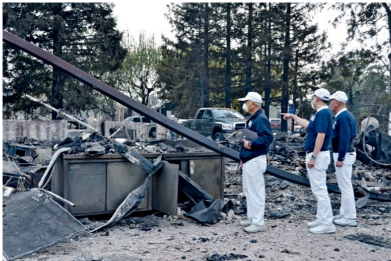
▼ 美國加州北部去年十月初發生森林大火，山林、房屋被燒燬，慈濟北加州分會、聖塔羅莎慈濟志工前往災區勘災，提供受災民眾適切的援助。

济人素不相识，但是慈济人以“无缘大慈，同体大悲”之心，想尽办法凝聚大家的爱，给予“安隐乐处”，这就是菩萨心、