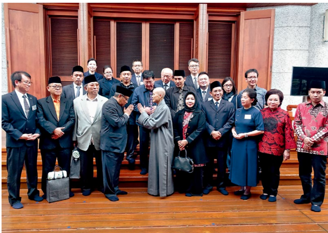
▲ 印尼伊联会主席萨义德（合掌者）率团访台，拜会慈济志业体。（4月18日）

佛法道理？上人表示，人圆、事圆，理才能圆；没有圆融的人事，就无法会理。“凡夫烦恼无明深重，以致人间多灾多难。每个人都有各自的见解，都认为自己是正确的、自己最有道理，而排斥不同见解的人。但是观念相合的人，也不见得能合心做好同一件事，所以会起烦恼、生摩擦，变成高兴了就多少做一点，与人若有不愉快的事，就退缩不前，无法培养起道心。”