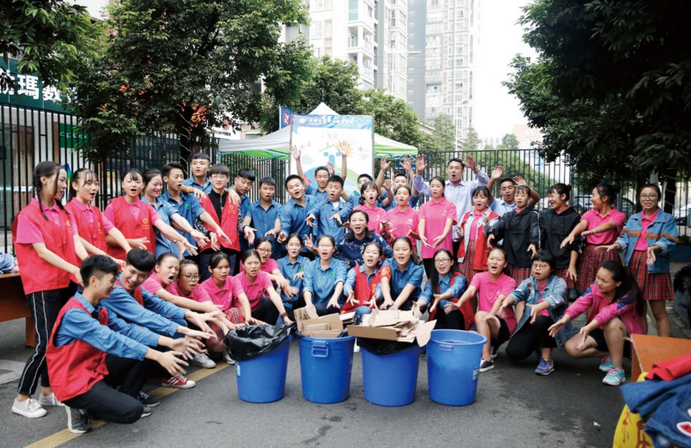
杜绝每天大量的快递包装盒进入校园，学生志愿者们在取货现场马上进行回收。