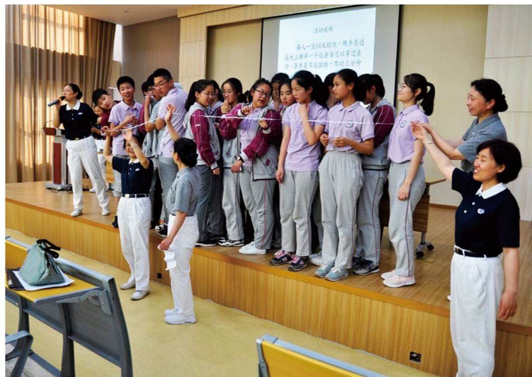
老师展示了一张剪好的A4纸，竟然可以围住二十五位同学。