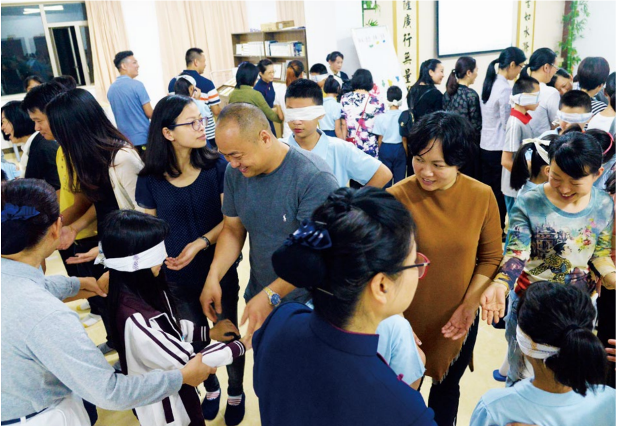
撰文/摄影/东莞真善美志工