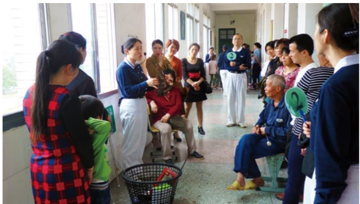
（下图）了解之后更要体验环保分类实做，巩固所学分类知识。