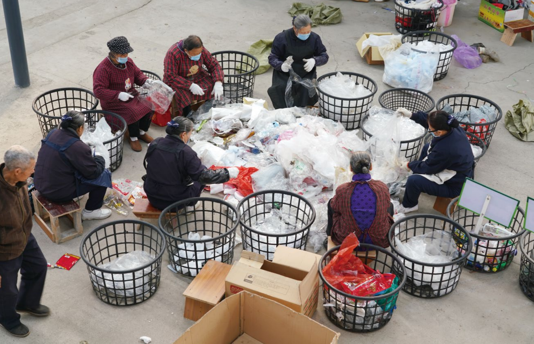
环保志工来到成都金堂环保站分类塑料资源。川震后，慈济赈灾优先，之后推动环保，居民逐渐挥别阴霾，也找到全新的生活重心。