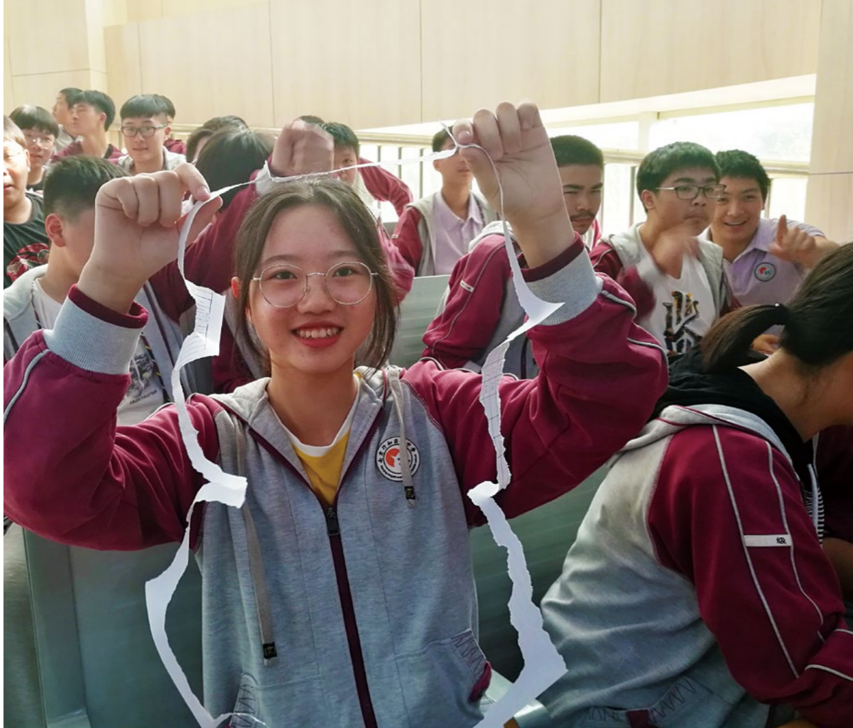
南京行知实验中学初三三班的学生在志工的引领参与体验减压教学，体验“肯定自己，人有无限的可能。”摄影/曹莉萍