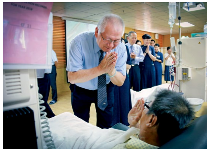
◀ 美国慈济志工参访马来西亚志业体，向慈济洗肾中心肾友问好并送上祝福。