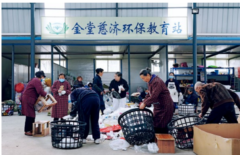
◀ 位于成都淮口镇的金堂慈济环保教育站，由板房改建而成，每周固定有志工前来参与分类。

于当下、持诸善法在分秒中，一心向道；自己蒙受法益，也常常与人分享法喜，带动大家一起修持善法、力行善道。