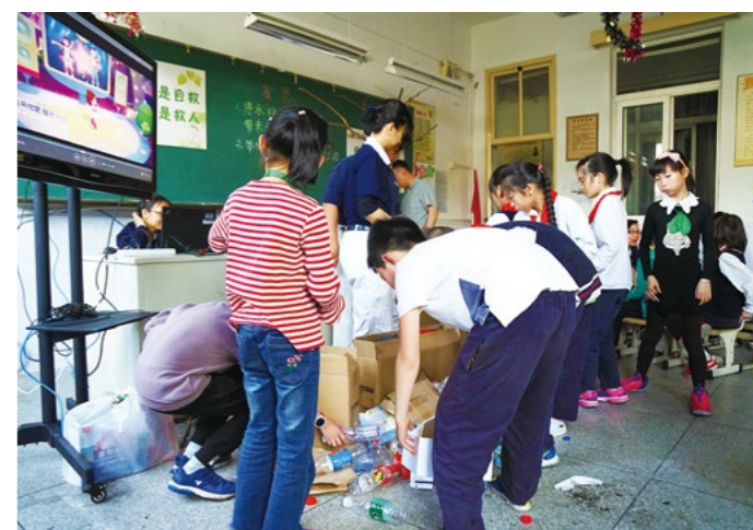
(下图) 有些孩子发现有些瓶子里的水没喝完，不知该如何处理。志工们把握机会宣导清净在源头的环保理念。

经过上几次的环保课程后，孩子们回家也都和家人分享了环保理念。这次环保分类，有些同学带来了全家合力捡拾的一百多个塑料瓶。分类时，全体同学也一起参与帮忙，踩扁瓶子与整理纸盒。