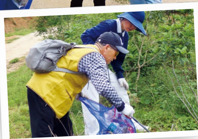
(下图) 一路上山，地面的瓶瓶罐罐，水沟中塑料瓶都被志工们一一捡拾，垃圾都被清理得干干净净。

文烨，今年读小学三年级，当天她也来到现场学习环保知识。平时害羞怯场的她接受志工的采访时表示：