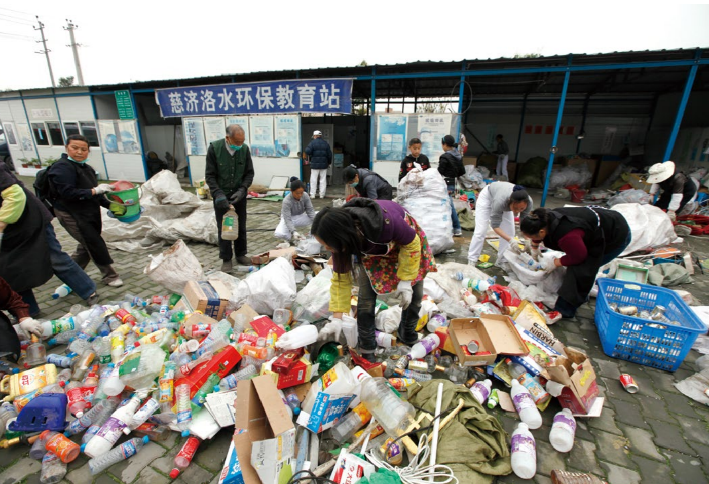
旧时洛水环保教育站设备简单，居民仍在重建阶段，依旧热心前来分类资源。