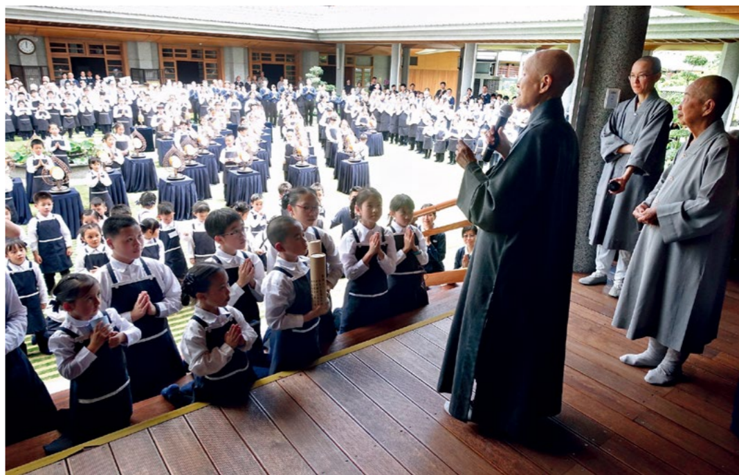
▼ 来自全台各地的静思书轩小志工钟鼓演绎之后，一起发愿成为小小传法者；上人勉励心宽念纯，坚定志愿。（4月22日）

并且落实在生活中，触事会理，发挥生命良能，“岁月不饶人，人生无常，趁着身体还可以自主行动、还有力量的时候多加利用。”