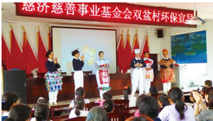
（上图）志工在双盆村会议室举行环保倡导，除了演绎环保话剧，也分享了环保十指口诀，让大家很快了解了分类回收的要领。