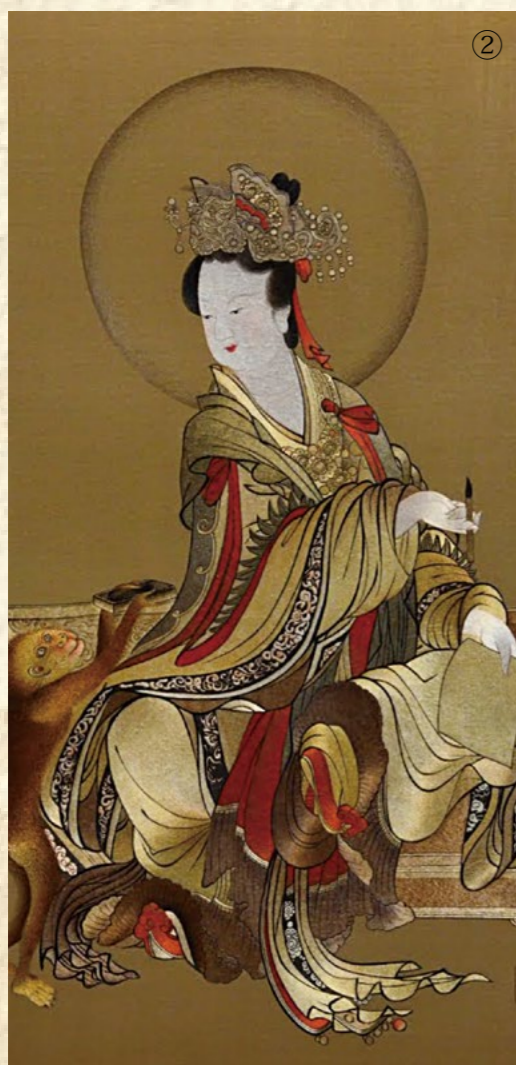
图①簪花仕女图 图②猴侍水星神图 图③瑞鹤图 图④群仙祝寿图