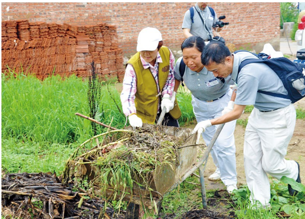
志工们利用手推车齐心协力地将杂草杂物运出垃圾堆，进行分类堆放。