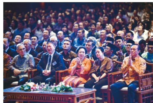
▲ 印尼六月四日举办全国佛教卫塞节活动，政府肯定慈济志业超越宗教、种族，故选定静思堂为主办场地，近两千位各界人士出席，包括印尼第五任总统梅嘉瓦蒂女士（前排中）、第六任副总统苏德利斯诺先生（前排，左一）。

去做就对了。创立慈济的时候，不知道会有今天的规模，也没想到会有这么多国家的慈济人，都是人与人之间把握因缘，彼此接引而来。”上人教师兄珍惜并善用时间、空间，也要把握人与人之间的因缘。