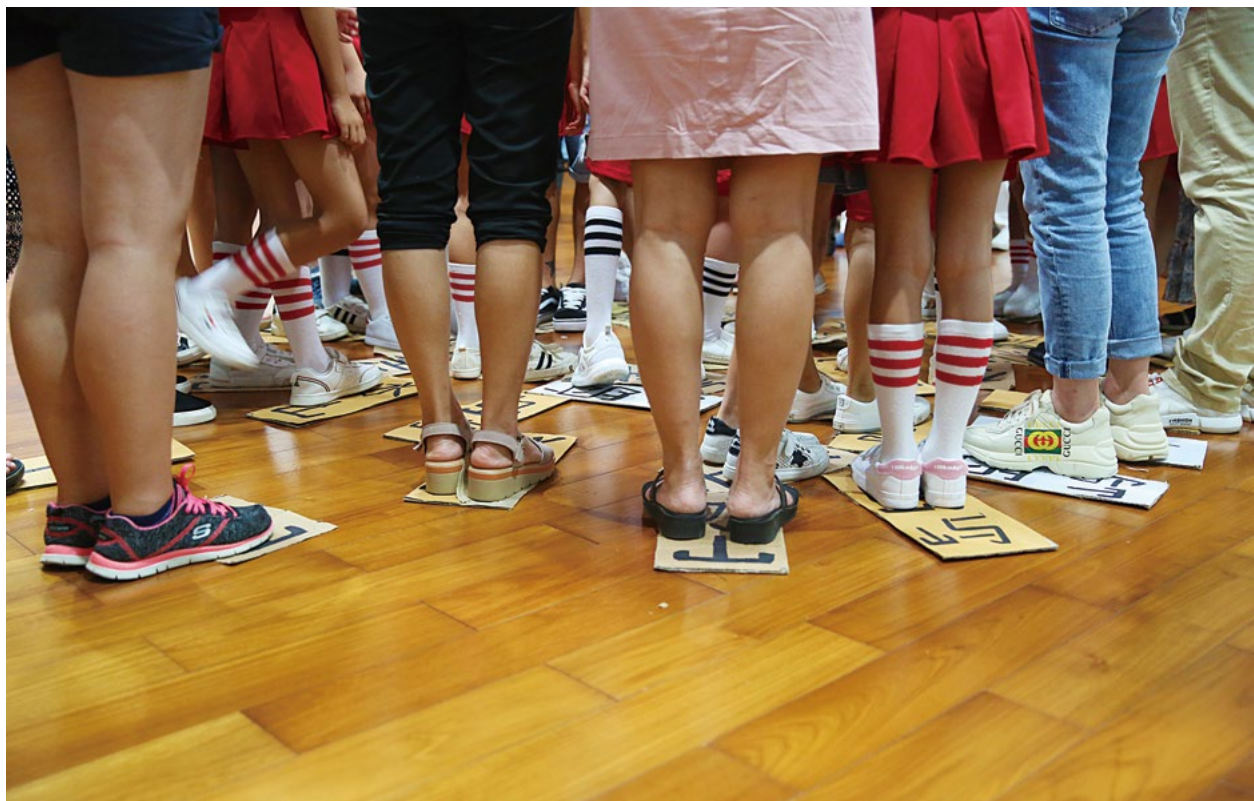
撰文/余凯