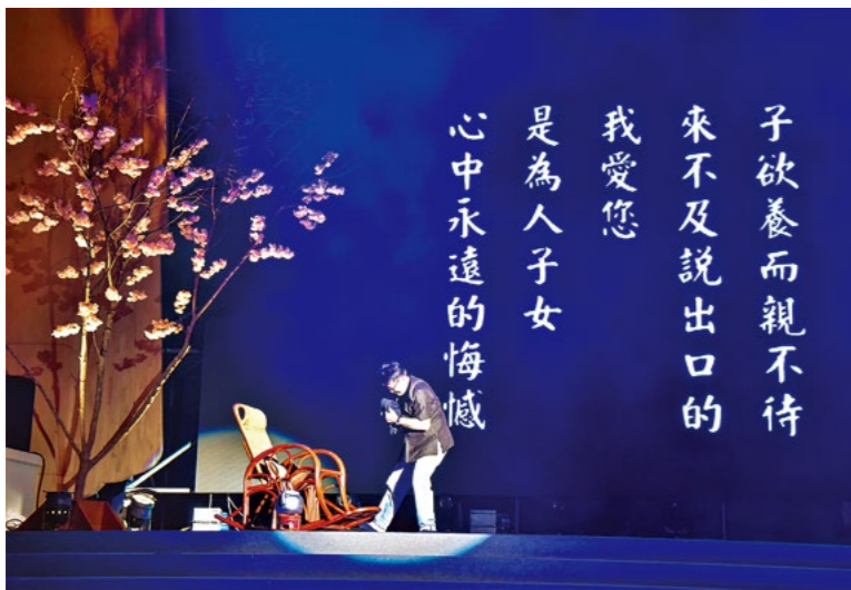
◀ 高雄静思堂八月三日到五日连续举办多场“七月吉祥孝亲祈福会”，志工们演绎《父母恩重难报经》音乐手语剧，事前用心排练。

父传法，他们用心体会；师父如果不在，他们就要负责将法正确地传承下去，世世代代都要维持自力更生的静思家风。所以精舍常住日日辛勤忙碌，就是为了把这个家照顾好，除了维持精舍的生活，还要当慈济的靠山。”