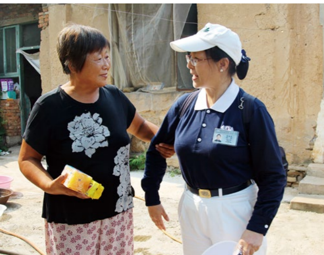
马奶奶语重心长地叮咛志工，现在的人没体会过辛苦，不过还要记得，一粒米一滴水都不要浪费啊。