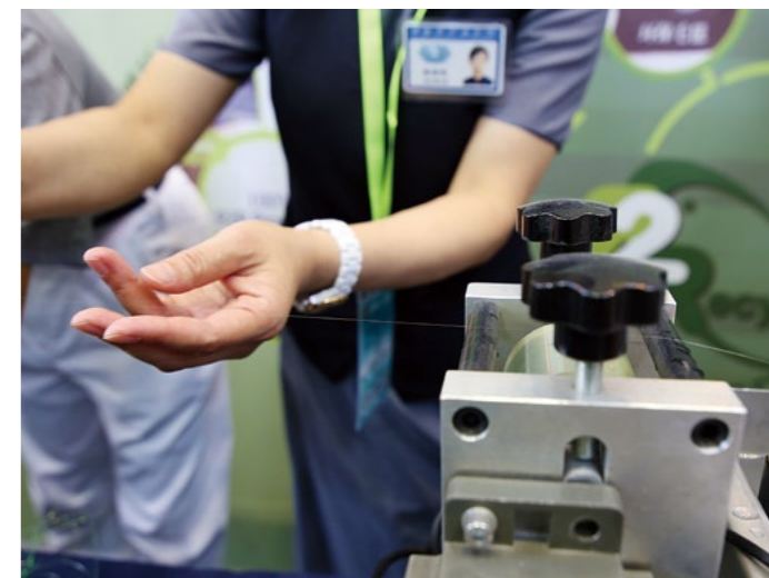
志工们互相配合，以生动的形式向大众展示塑料瓶片造粒抽丝的过程。