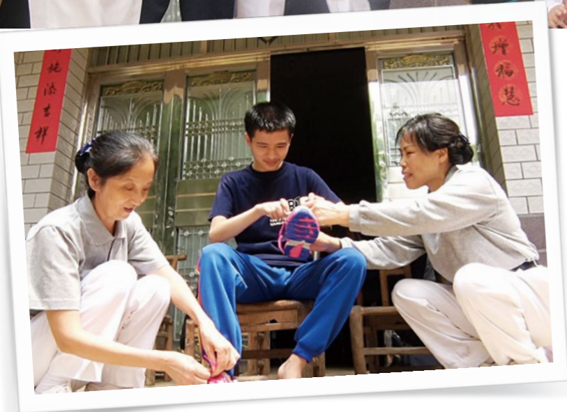
（上图）原本内向的阿良在志工的鼓励下逐渐开朗起来，并学会拿零食与邻居一起分享。