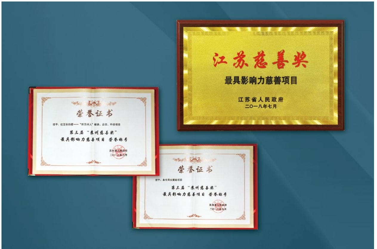
撰文/范一莲