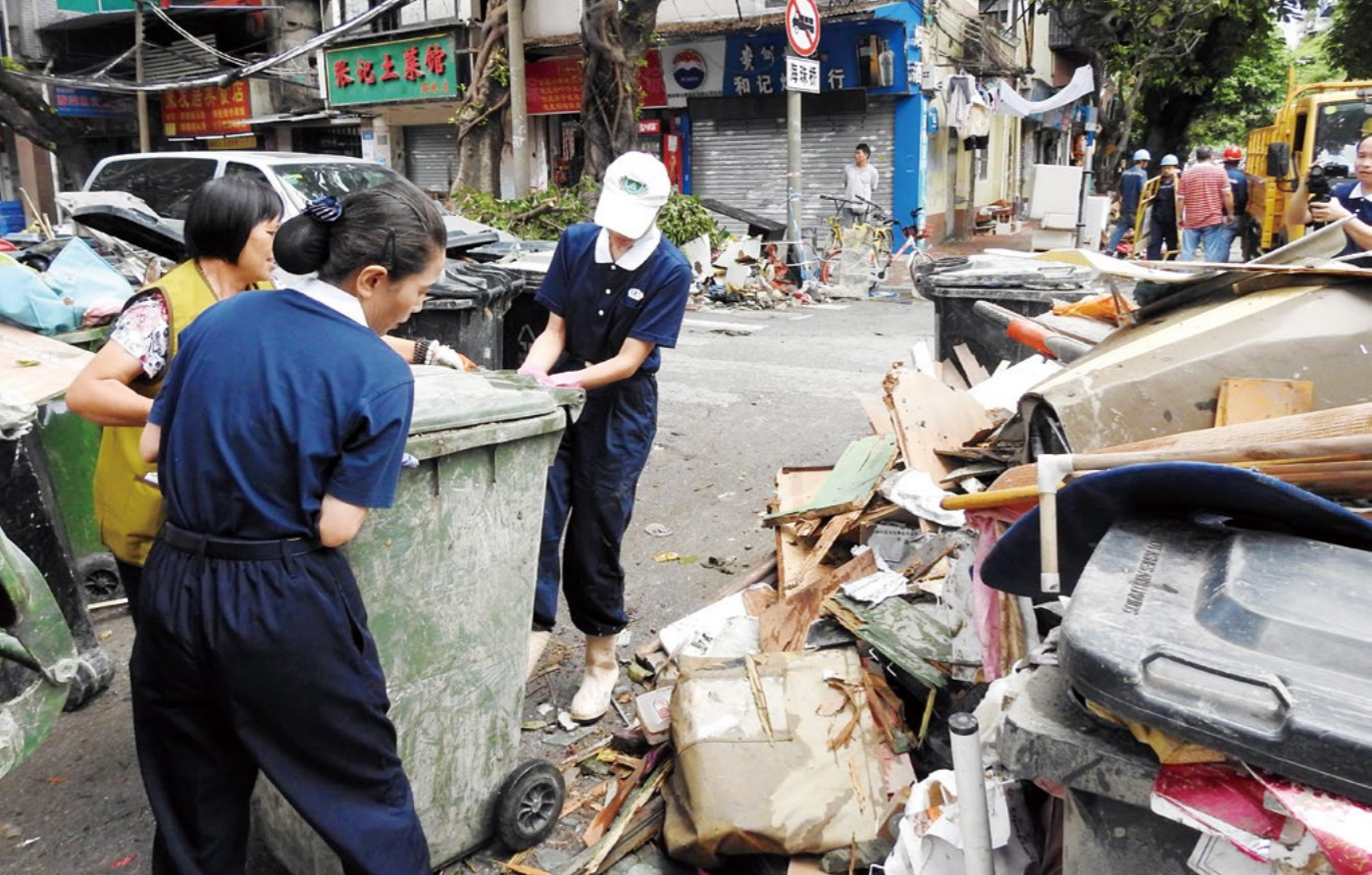
(上图) 志工一趟趟搬运小巷中的堆放物, 保证巷道通行顺畅, 方便街坊出行。