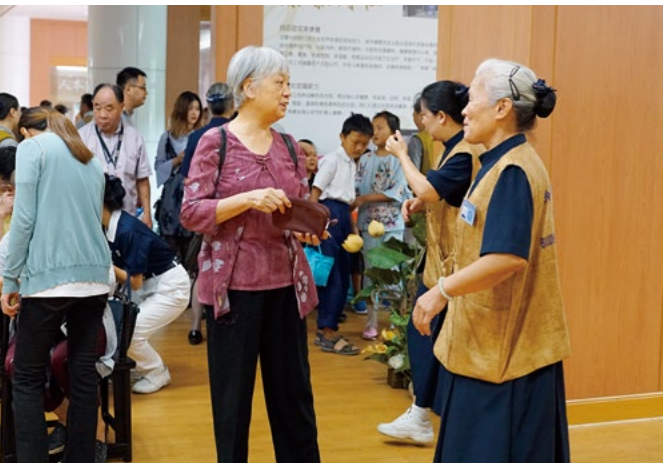
候诊区内，医疗志工与民众们亲切交谈，减轻他们的焦虑感，耐心地解答他们的疑惑。

还是以治疗为主，如果我们把慈济的人文关怀精神和健康教育文化引入，我觉得会是一个很好的开端。”