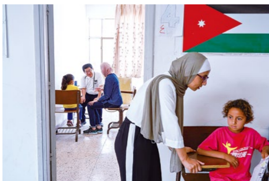
慈济约旦分会成立二十六年来，持续关怀周边国家难民与本地贝都因人，今年七月与来自台湾的慈济义诊团合作，为叙利亚难民提供医疗服务。

民，欧洲多国慈济人轮流守护，支援难民营每天供餐两次。多年来，难民人数不减，需要人间菩萨以群体之力为难民付出。”