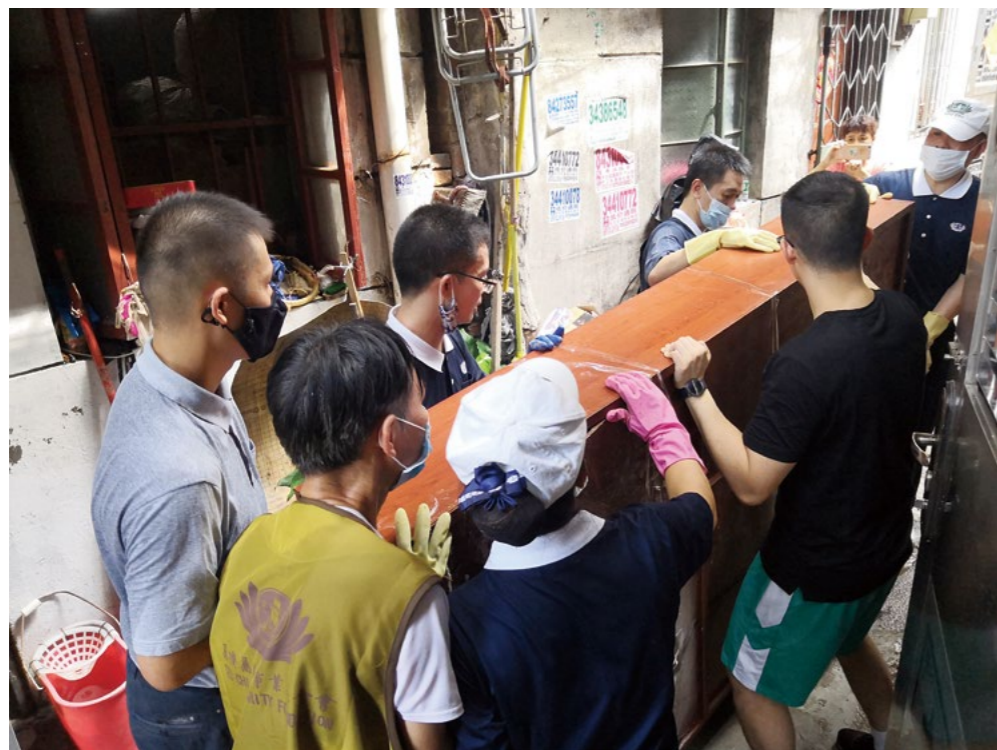
(下图) 浸泡过的大件家具已经无法使用, 几位志工协助把柜子从街坊家中搬运到垃圾堆放处。