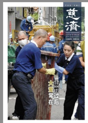
封面图说： “山竹”台风过后，志工们合力将被水泡坏的家具从街坊家中搬运到垃圾堆放处。