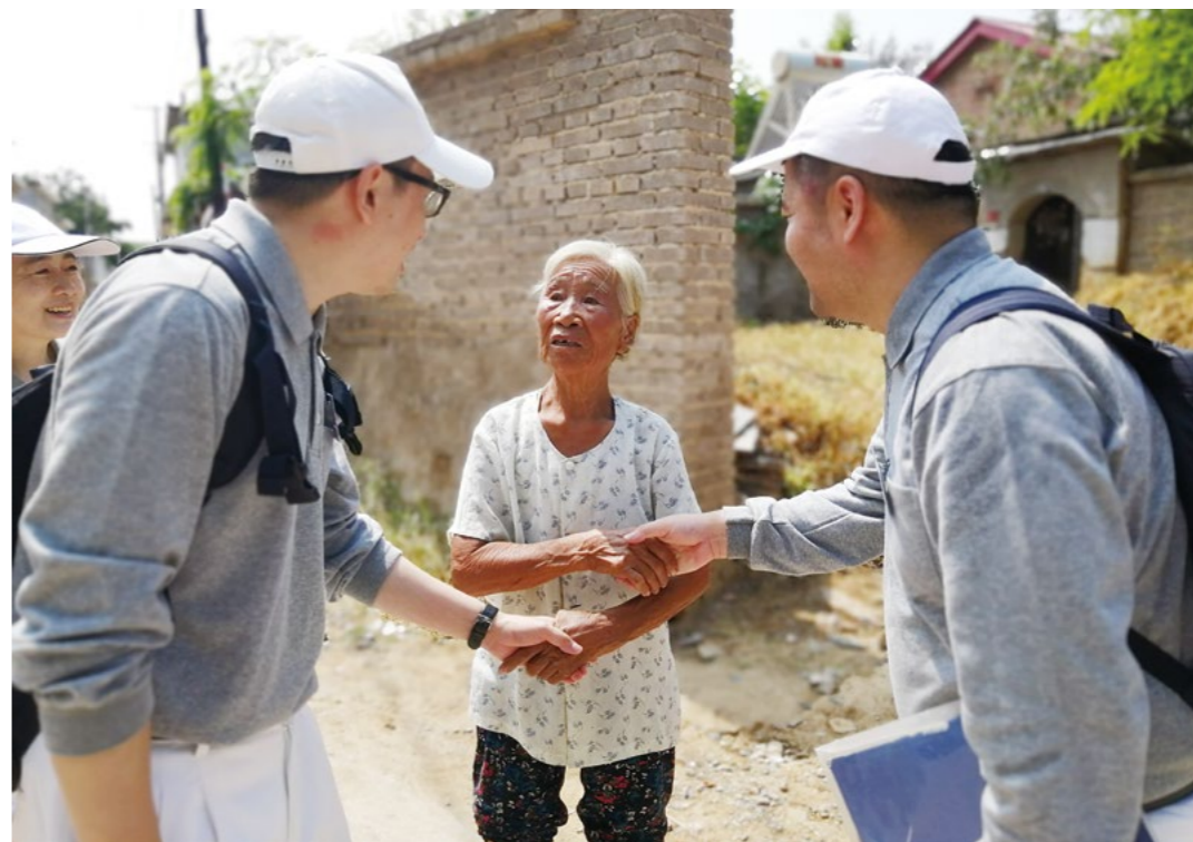
尹奶奶将志工送出很远，不舍地拉着志工的手，让大家下次一定要到家中坐坐，吃个饭再走。

志工走进这些年逾古稀的爷爷奶奶家中，倾听爷爷奶奶过去的故事、现在的人生感悟。在付出的同时，内心获得的那份善与爱的力量，将督促志工继续前行，因为“能付出的人，就是最有福的人”！