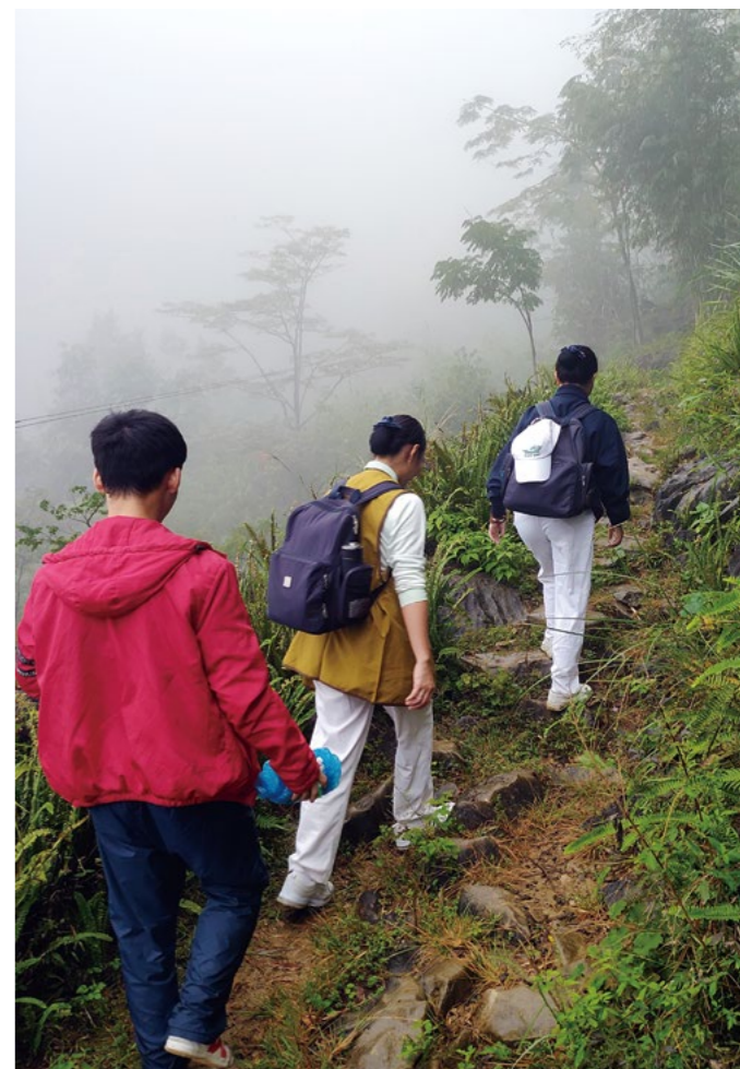
马山县山多平地少，慈济志工经常徒步上山关怀助学生。

“我身上穿的衣服是初二时代表学校参加比赛买的，现在还很新。自己买的衣服不多，大部分是姐