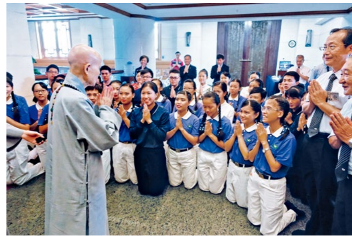
◀ 上人于花莲静思堂观看「七月吉祥孝亲祈福会」（上图）。参与《父母恩重难报经》音乐手语剧演绎的慈青欢喜问候上人（下图）。（9月9日）