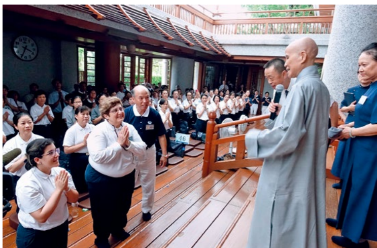
◀ 巴拉圭慈济人医会梅沙医师于二〇一五年往生，他的同修师姊与家人实践其心愿，每年固定来台参与国际慈济人医年会。（9月24日）

苦，这份关爱能抚慰心灵的苦痛。也很庆幸许多国家已经有慈济志工，会接手关怀严重的病症，或是安排进一步治疗。”