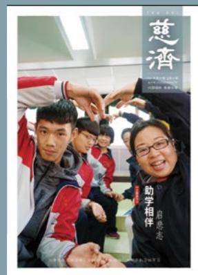
封面图说： 慈济志工来到河北易县中学助学， 与学生欢喜“合心相印”。