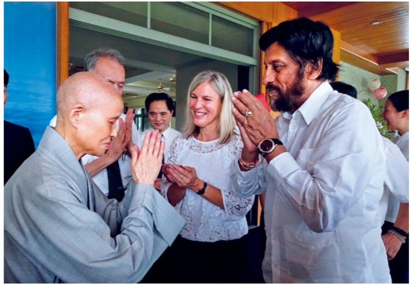
联合国政府间气候变化专门委员会前主席帕乔里博士（右一）等外宾，受邀于慈济人医年会演讲，并与上人晤谈。（9月23日）

上人说，慈济人在台湾长年累月照顾的弱势家庭，不只有独居长者，慈济慈善也不离医疗，更不离开教育与人文。四大志业已经建设完全、推展开来，大家要回归精神层面，把握正确方向，人力、物力都能就地取材；只要具有这样的精神，也愿意去做，就可以救无数天下人。