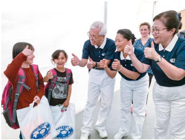
◀ 九月三日 to 六日，德国、英国、奥地利、意大利、新加坡、马来西亚、台湾慈济志工前往塞尔维亚，与波士尼亚及塞尔维亚志工共聚，为难民营儿童补充文具与书包。