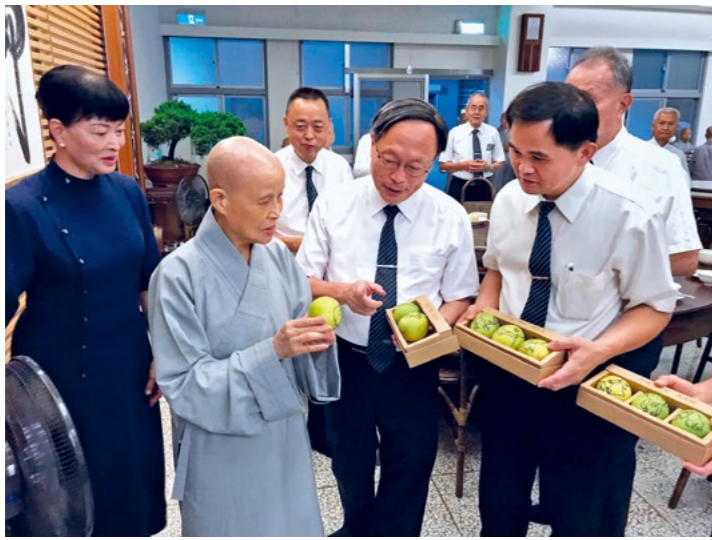
大林慈院主管同仁认购八二三热带低压水患受灾农户栽种的柚子，并在柚子上画图，与慈济人医年会学员结缘。（9月21日）

则是满心烦恼，总是受无明业力纠缠。所以，是要修禅，还是被烦恼纠缠？端看自心能否放下利欲执着，放开心胸、付出无所求。