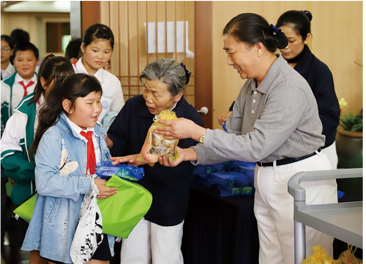
撰文/范一莲