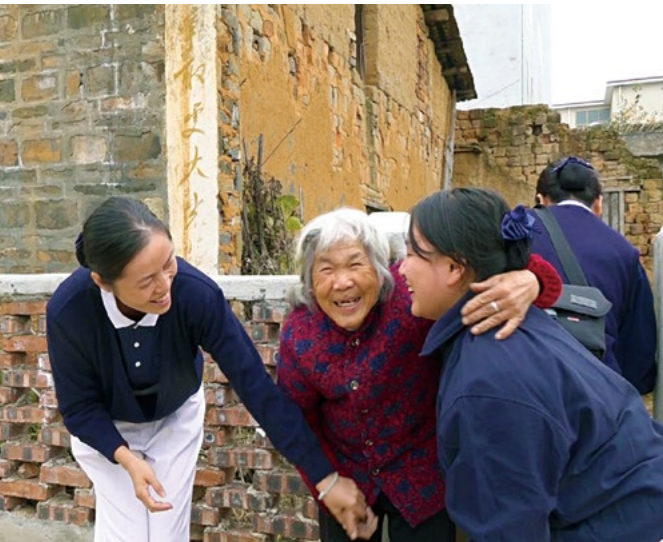
屋场村民风淳朴，与前来关怀的慈济志工热情相拥。