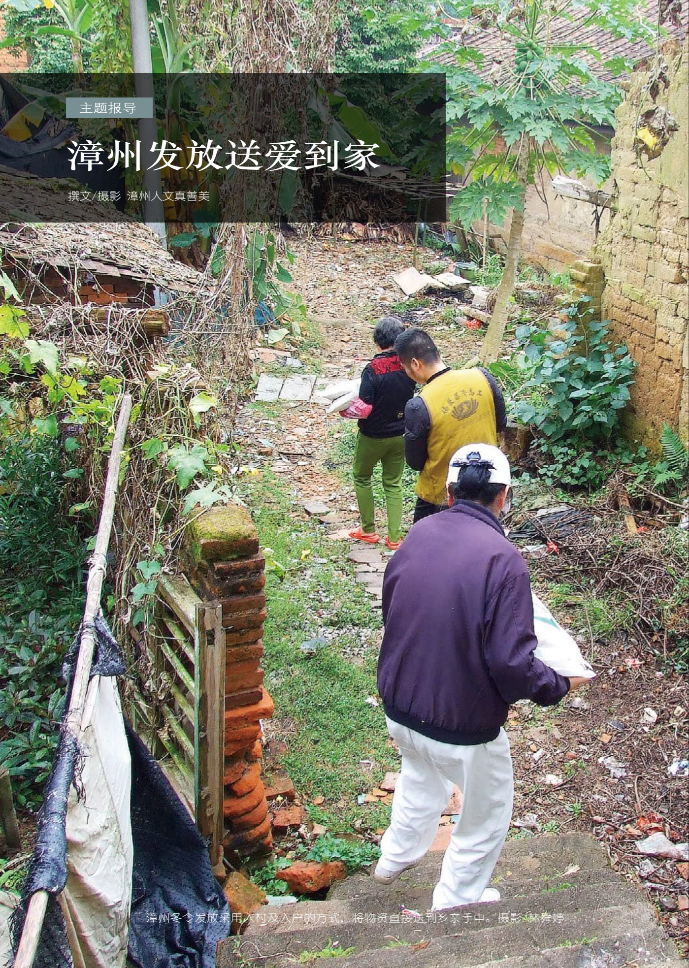
漳州冬令发放采用入村及入户的方式，将物资直接送到乡亲手中。

本着直接重点的原则，因地制宜，漳州第八年的冬令发放，分别在龙文区朝阳镇及芗城区的天宝镇进行，采用入村及入户的方式，将物资直接送到乡亲手中。此次发放对象大部分都是老人，入村入户发放让乡亲们在家门口就可以领到物资。两天共发放四百零九户，嘉惠乡亲六百二十二户。