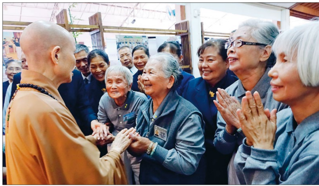
▼高龄环保志工欢喜见上人，发愿要活到一百二十岁，健康付出，并且生生世世做慈济。上人回应，不论几岁，都要持续耕耘人间福田。（11月20日）

慈济。她闻言开导：“有钱才能救人啊！国内是人，国外也是人，能救人比被人家救好啊！”