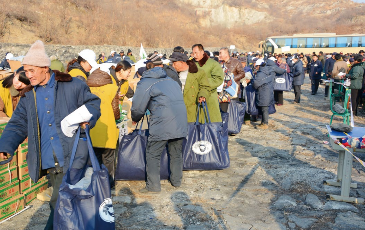
慈济志工分别在河北易县南城司乡与富岗乡举办大型冬令发放活动。

十二月十七日至十八日，慈济志工们分别在河北易县南城司乡与富岗乡举办大型冬令发放活动。慈济六年前曾在富岗乡举办过发放活动，当时的发放惠及九百五十二户，近一千五百人；六年后，慈济志工们再度来到富岗，惠及的村落较前次增加了上铺村、下铺村、源泉村三个村子，共计一千两百三十九户，一千七百七十四人领取到物资。两天的发放活动中，慈济志工们齐心为乡亲们付出，将发放的动线变成了一条条温暖的爱心传递线。