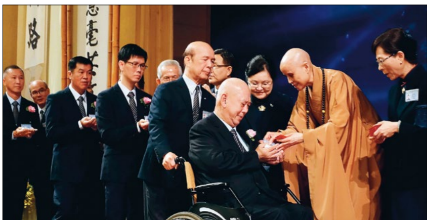
◀上人为海外慈济人授证，勉众恒持“佛心师志”，承担天下使命，力行菩萨道。 (11月4日)