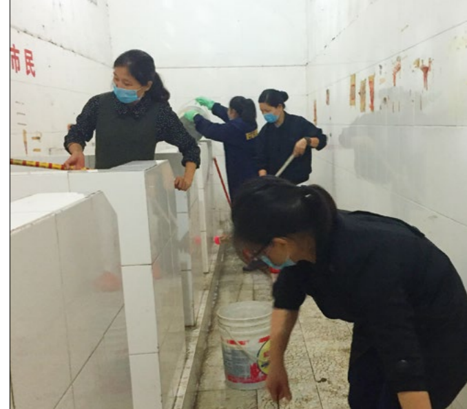
志工一来到公厕见到如此脏臭本来还有些害怕，但是想到发放时能给乡亲方便，还是克服了那臭得让人反胃的味道。

比较不会对孩子凶。慈济团体的是做实事的。所以也想把身边所有的人都邀请进来。”黄华英道。