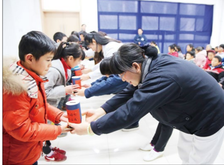
(左) 当助学生看完志工“日存五毛钱”的故事，志工们为孩子们准备了小竹筒。