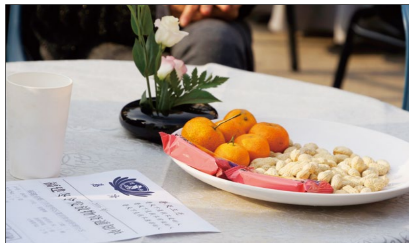
乡亲们就座的圆桌上摆放了鲜花、水果、点心和热姜茶，舒心又暖心。

恩你们哦，一直来关心我。”她身上穿的一件带有慈济标志的毛衣让志工好奇，都说不曾见过这衣服。她说那是十二年前慈济冬令发放的衣服，更让志工惊奇。她直夸衣服的质量：“这衣服真的太暖太暖了！”