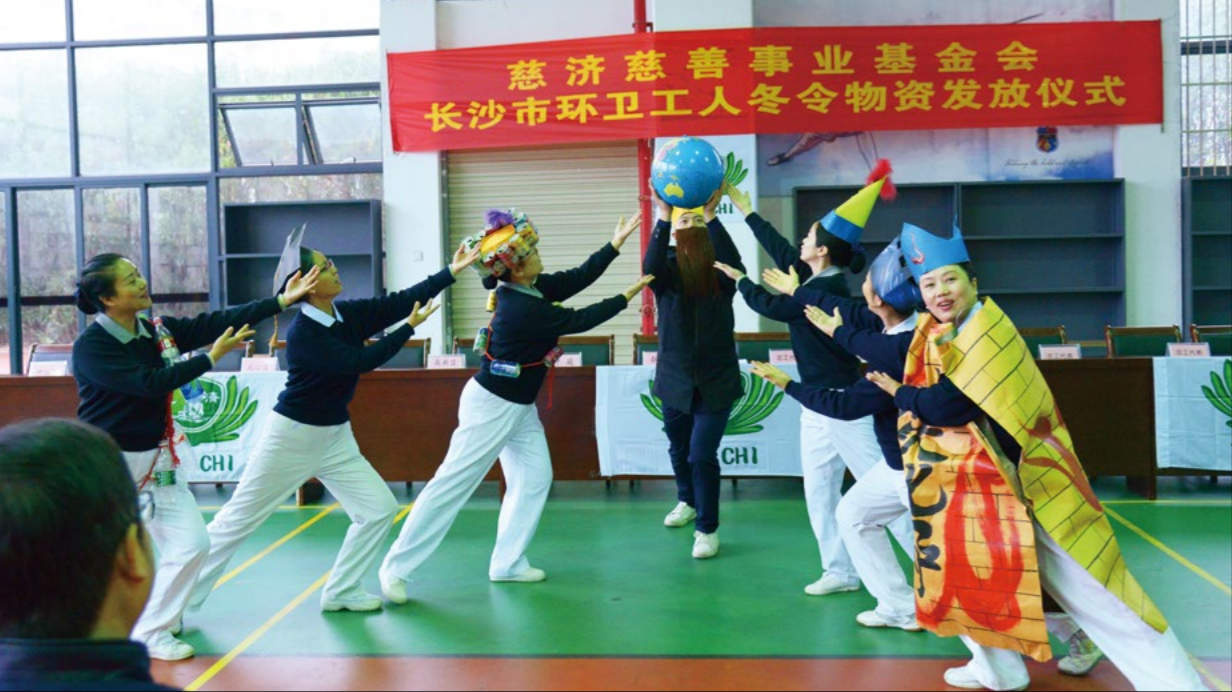
志工演绎环保话剧《地球生病了》。