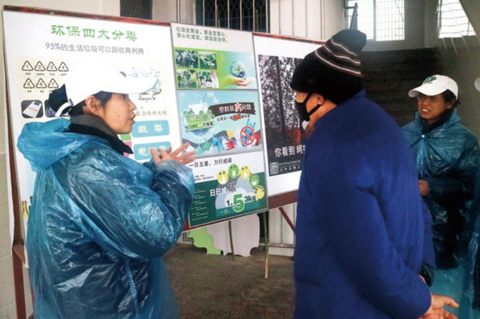
志工们正在耐心地为乡亲们和学校工作人员解说展板内容，宣传环保。