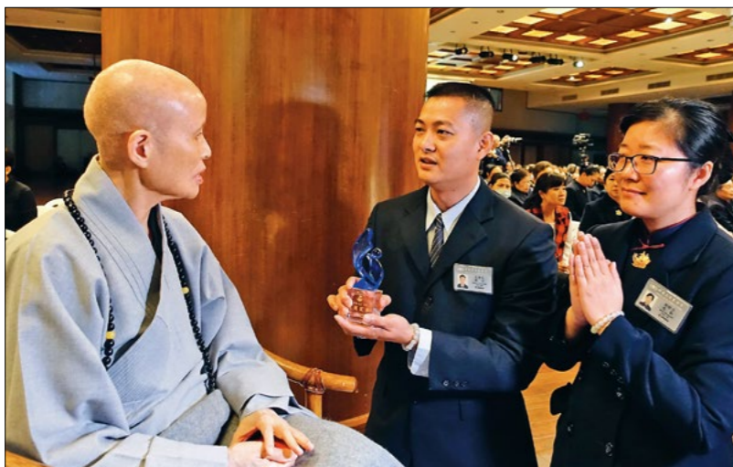
◀曾是更生人的高肇良师兄（右二），投入监狱关怀及反毒倡导不遗余力，获总统府及法务部表扬。上人勉励坚定道心，踏实修行。（11月17日）

天带着用台湾爱心米袋改制成的环保提袋，拜会外交部及农委会。上人表示：“爱心看不见、摸不着，但是经由慈济人实际走到，就能让大家感受得到。世界各地的受助者不只‘感谢台湾’，还能翻转手心，发挥爱心成为助人者。”