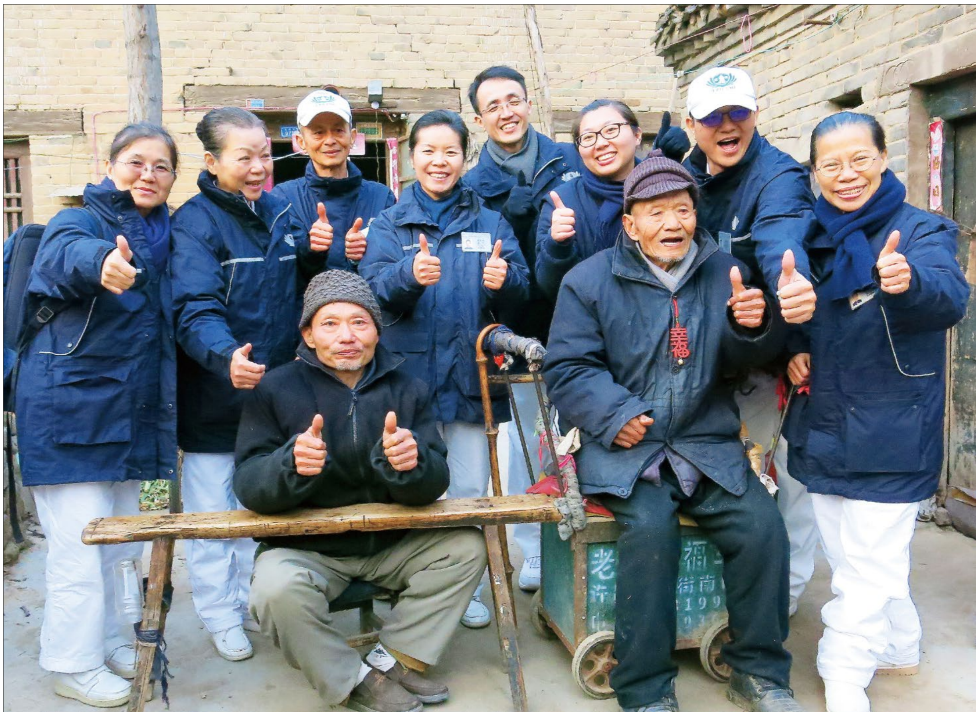
志工们入户发放，为出行困难的乡亲们送去关怀和冬令物资。乡亲们开心地与志工互动合影。