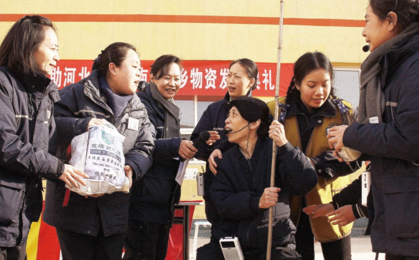
志工为乡亲编排了情景剧来介绍慈济的慈善关怀。

她的家，老人还清晰地记得，当年发放的棉被特别的暖和，还有米、面、油等物资，“慈济志工特别好，心地善良，问寒问暖，就像亲人，很温暖！”说起慈济志工，老人的话语充满感激。虽然老人身体不好，但今天依然和二儿子一起来到发放现场，老人说：“今天来，就是想看看慈济家人，祝福好人们一切平安顺利！”