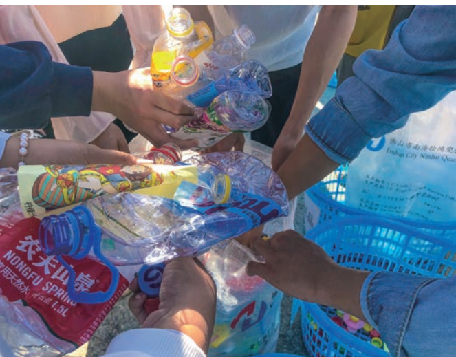
宿舍日常生活产生最多的是饮料瓶、纸板和泡沫等，志工和同学们用两个多小时整理出二十七袋的饮料瓶。