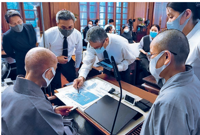
天鹄台风侵袭菲律宾，志业体主管同仁报告慈济人勘灾情况。（11月3日）

“皈依佛，两足尊；皈依法，离欲尊；皈依僧，众中尊，这是无上正等的荣耀！我为大家见证，大家已是佛弟子，入佛门来就要守戒律，守戒才能成长慧命；身不犯戒，才不使烦恼无明不断覆盖于心。将过去的烦恼无明扫尽，现在以菩萨为伴侣，以救度天下众生为目标。”