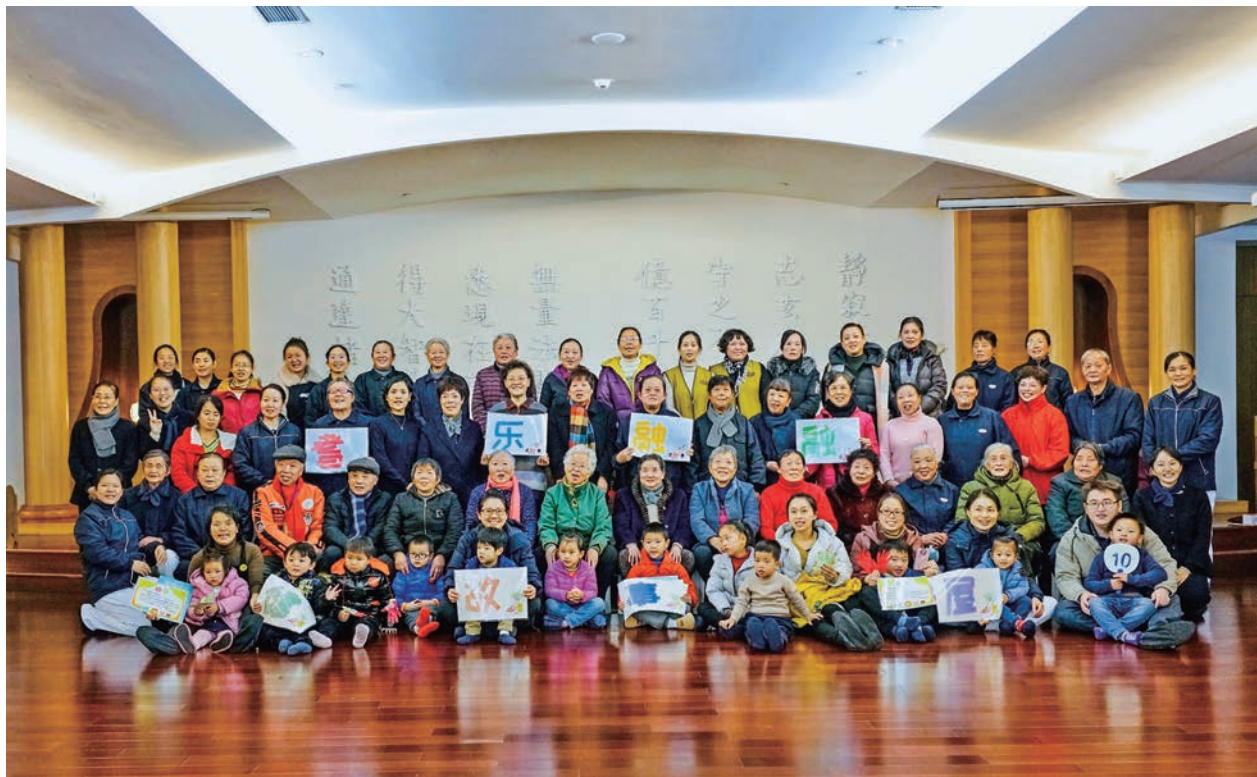
撰文/郭奕艳、杨婕、莫佳妮 摄影/张秀英