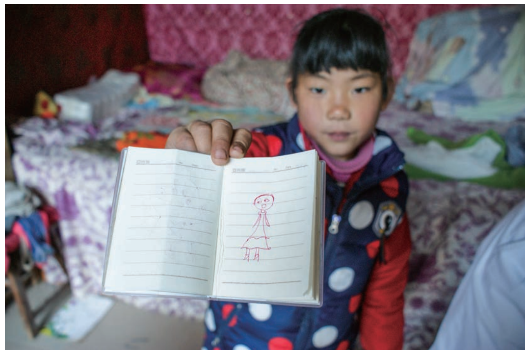
志工为智力障碍的妈妈理发、洗头，小女孩不仅帮忙，还为妈妈画像，又扑到妈妈怀里幸福地撒娇。摄影/杨琳

家里享受国家低保、孩子上学免费、老人有家庭医生，再加上占地补助和分红，基本生活倒是过得去。