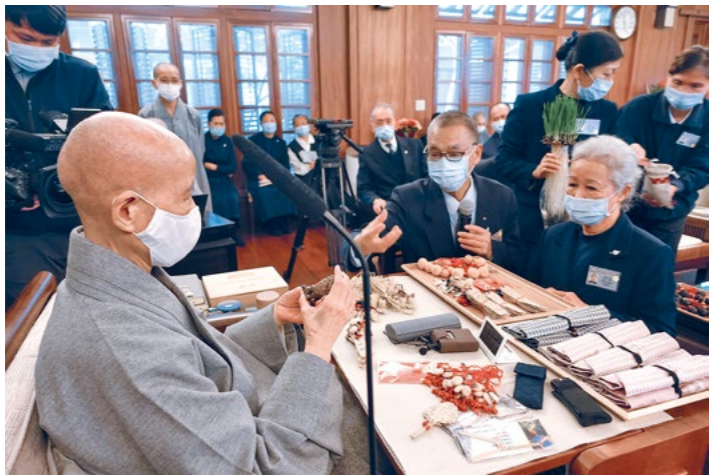
台中港区慈济人展示蔺草编制品及种子吊饰等。上人感恩慈济人带来“故乡的气味”。（2月8日）

共计六十天，直到昨日在花莲静思堂圆满全台授证暨岁末祝福典礼，总计四十八场，逾八万六千人参与。此外，上人在各地的岁末祝福与温馨座谈，总计三百四十场，逾十二万一千人次参与；经由网络连线同步聆听者，来自逾十五万六千个连线点。