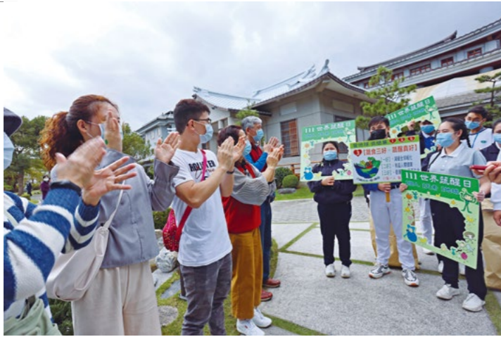
全球慈济人积极劝素，菲律宾籍慈济科技大学学生向来到静思精舍过年的会众倡导“吃素爱地球”。

示期勉大众：“时间像流水一样不断流过，分分秒秒迅速消逝。已经是新春第一个月圆日，正月十五元宵节；每个月总有月缺、月圆时，圆了再缺，缺后又圆，人从出生之