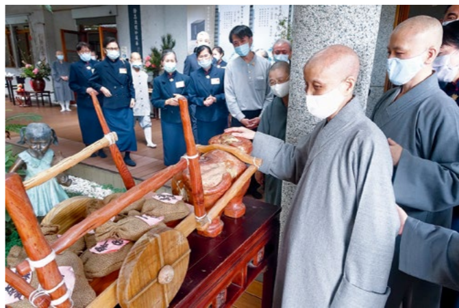
大年初二，法亲会众纷纷返回精舍拜年，上人看视志工用心布置的茶道休憩区。（2月13日）

大年初二的志工早会，上人安慰因疫情限制，无法“回娘家”的海外慈济人与会众，新冠肺炎的“大哉教育”，让大家暂停忙碌的脚步，静下来思考自己的心念有没有脱序，人生有没有偏离方向；随着欲念追逐名利享受，是否已经追