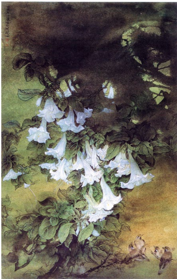
画作 / 林淑女

现代科技发达，让我们的眼界开阔了，但也要能看见天下危机四伏，有所警惕。天天都能听到全球气候不调顺的