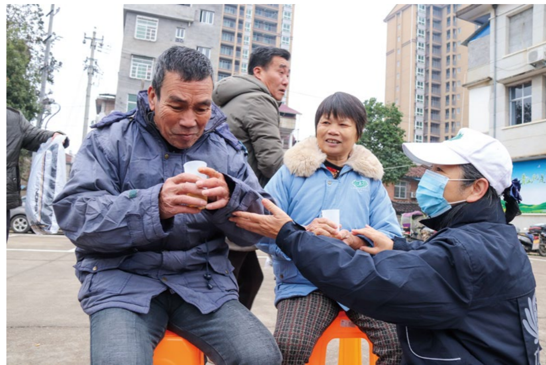
乡亲魏爷爷和王奶奶当日专程穿着二十二年前慈济致赠的棉袄来到发放现场，志工为他们送上暖暖的姜茶。